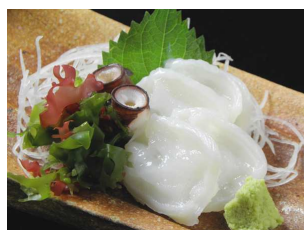
10月8日(木)～14日(水) 活北海たこ刺