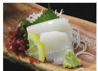
10月22日(木)～28(水) まいか刺