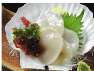
10月1日(木)～7日(水) 活ほたて刺