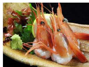
10月15日(木)～21日(水) 甘えび刺