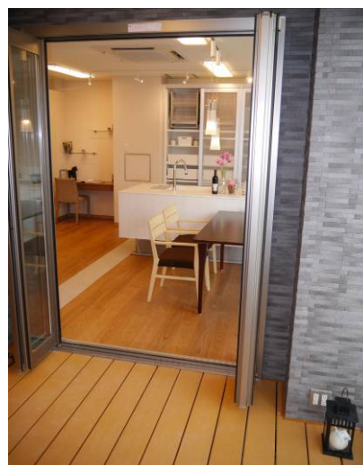
<戸建てゾーン・フルオープンサッシとウッドデッキ>