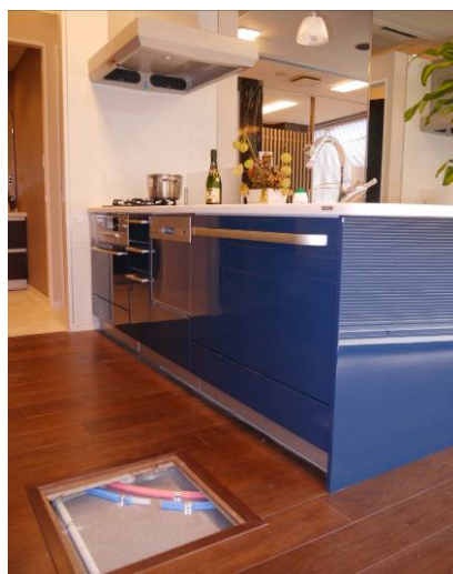
<マンションゾーン・キッチン>