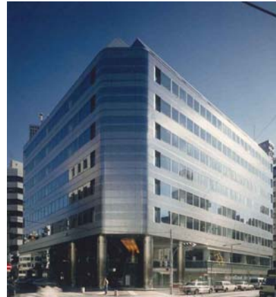
<住友池袋駅前ビル>