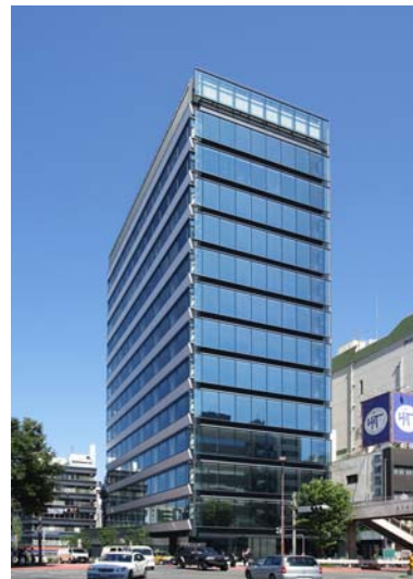
<住友不動産青山通ビル>