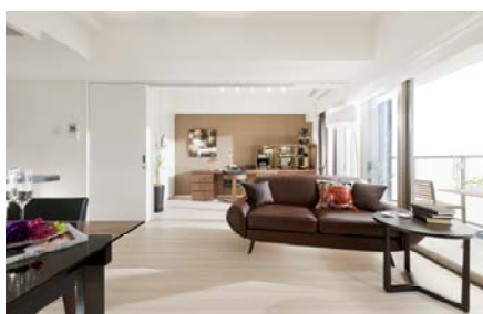
<コンセプトルーム>

最新の住宅設備機器や仕様を実際に目で見て、触れて、間取りなどをイメージしていただくコンセプトルームを複数※①設置しました。あわせてインテリアカラーや、内装材のバリエーションをご確認いただけるインテリアコーナー、さらにミストサウナ※②、インターホンのセキュリティ機能など、最新の設備をご体感いただける展示コーナーを設けています。※①渋谷は1ヶ所 ②渋谷は展示なし