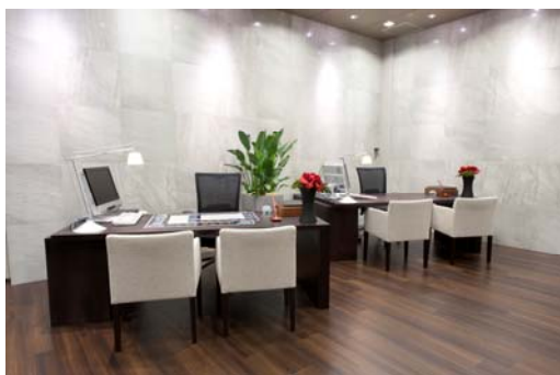
<コンシェルジュデスク>

物件を探し始める前にいろいろ話を聞きたい、相談してみたいというお客様に向けてコンシェルジュデスクをご用意しました。金利の話や新築分譲マンションと中古マンションの比較、購入と賃貸の比較などをご紹介します映像もご用意しています。