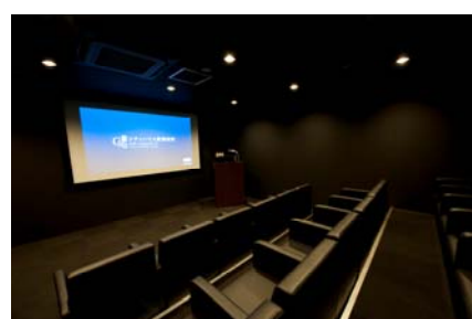
<コンセプトシアター>