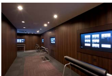
<タッチパネルコーナー>

分譲マンションをお探しのお客様には、弊社の首都圏全ての物件*がエリア別にわかる一覧ボードや電車の沿線別マップをはじめ、関心をお持ちいただいた物件の外観、設備、仕様などの特長がご覧いただけるタッチパネル式の大テレビモニター、各物件のパンフレットを揃えたパンフレット閲覧コーナーをご用意いたしました。また、住友不動産ブランドシアターでは弊社のマンションブランドのコンセプト、コンセプトシアターにおいては個別物件のコンセプトや現地周辺環境などを映像でご紹介しています。*平成23年10月27日現在 全77物件(販売予定も含む)