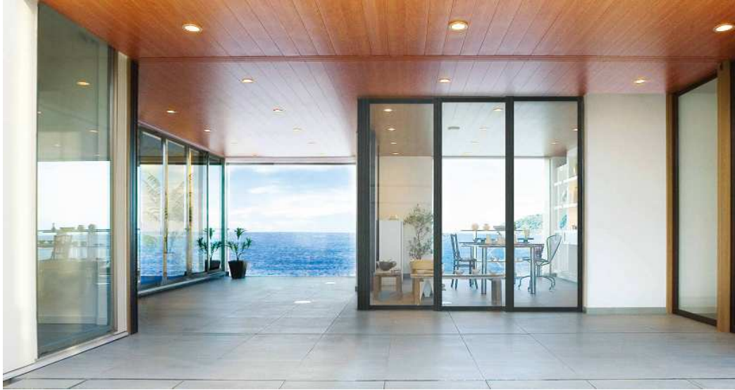
ガラス戸で仕切られたプライベート空間 「J・LADYルーム」

外部・半屋外・内部の 3 つの空間が、フラットな天井で連続しているからこそその自由な空間。爽やかな風が吹き抜ける、土間の半屋外空間である“インナーコート”と連なり、思いのままに時間を過ごせる離れのような空間で、新しい君を見つけて欲しい。