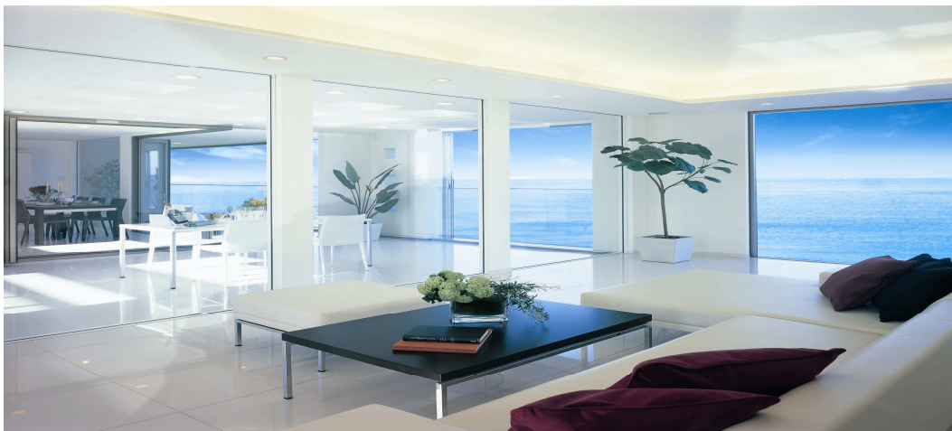
リビングからインナーテラス、ダイニングへと視界が広がる「フルフラットスペース」と「フルフラットハイサッシ」

床・壁・天井だけで構成される、梁の無いシンプルでフラットな空間に、“フルフラットハイサッシ”による圧倒的な開放感。さらに、“インナーテラス”を挟むことによって、外の広がりを取り込むリビング・ダイニング。日常の限らない心地よさとやすらぎを、君に。