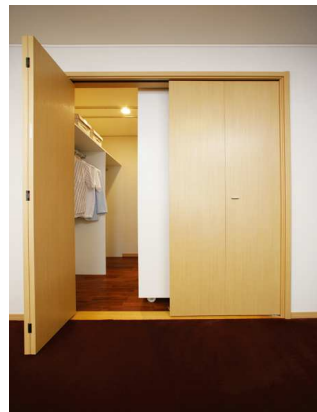
ムービングシーズンクロゼット