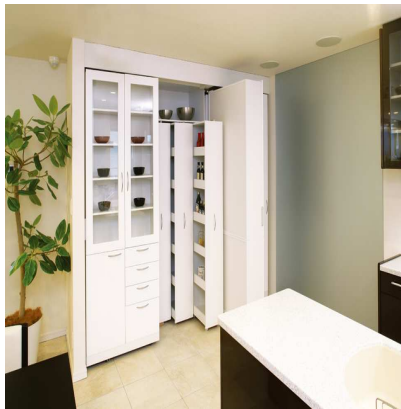
ムービングキッチン収納庫