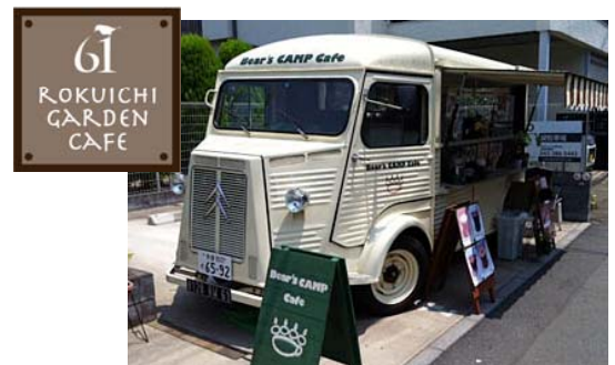
<キッチンカーイメージ画像>

イベント期間中は、足を止めゆっくりとイルミネーションをご鑑賞いただくため、点灯エリアに新たに加わる庭園にキッチンカーを入れ、テーブル、イスをならべた特設のカフェを設置します。ホットワイン、ホットサンテリアといったアルコールからホットコーヒーなどの温かい飲み物や、トルティーヤロールなど手軽に食べられる軽食を提供します。「六本木一丁目」駅側と「神谷町」駅方面側の双方に人の集まる仕掛けをし、さらなる賑わいの創出を図ります。