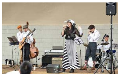
<Hiroco & Ragazzi>