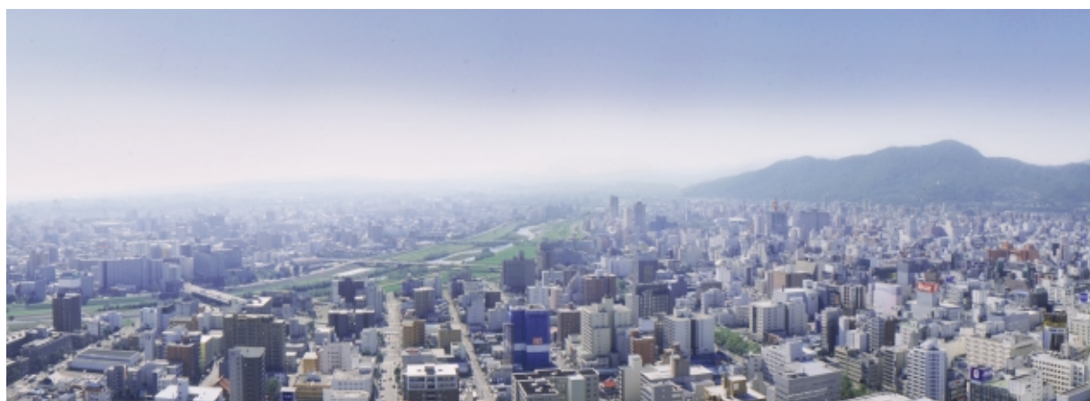
South View [創成川から豊平川方面]

このダイレクトスカイビューの実現により、バルコニー越しではなく、直接テレビ塔や大通公園の景色を足元に見下ろす、他には例のない眺望を楽しんでいただけます。