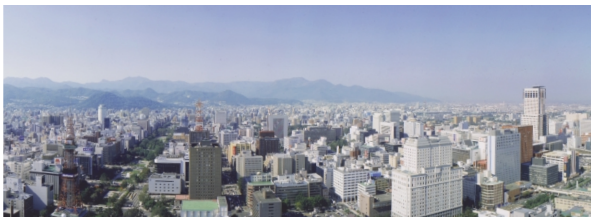
West View [テレビ塔から大通公園方面]