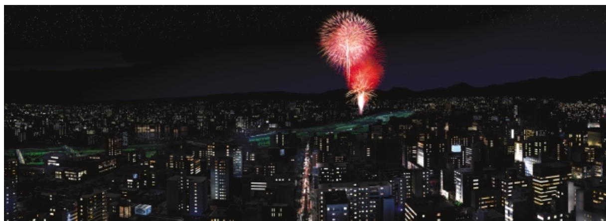
South View [創成川から豊平川方面]

このように、「シティタワー札幌大通」札幌すべての景色を余すことなく、楽しめる立地と企画を有しております。