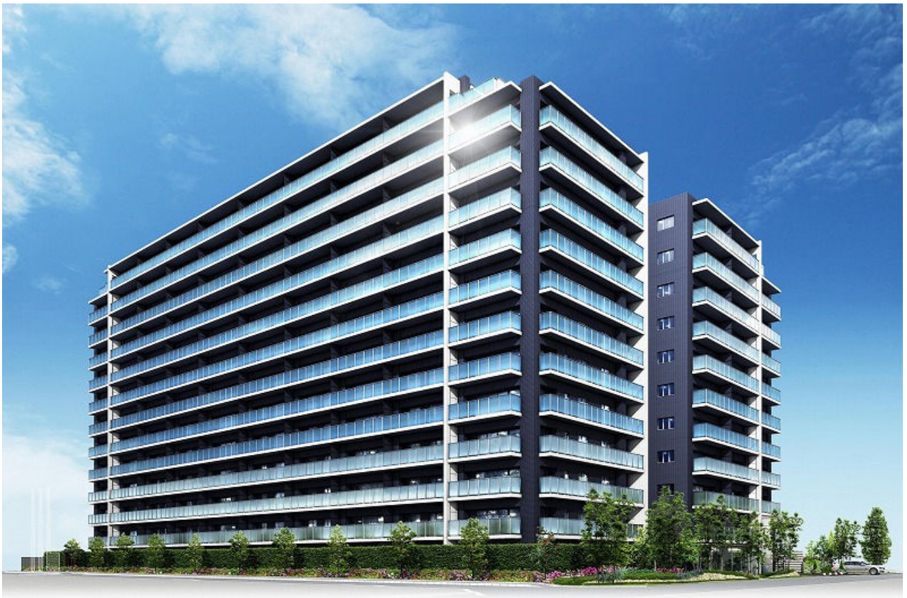
「シティハウス海老園マリーナコート」完成予想CG

本物件は、地上13階建て、全154戸の大規模レジデンスです。落ち着いた住環境にありながら、高い生活利便性を併せ持ち、さらには瀬戸内の海と宮島を望むことができるという希少なエリアに誕生する本物件は、マリーナをイメージした濃紺のタイルとバルコニー手摺に太陽の光で輝く波をイメージしたガラスを配した、街並みのランドマークにふさわしいファサードと致しました。