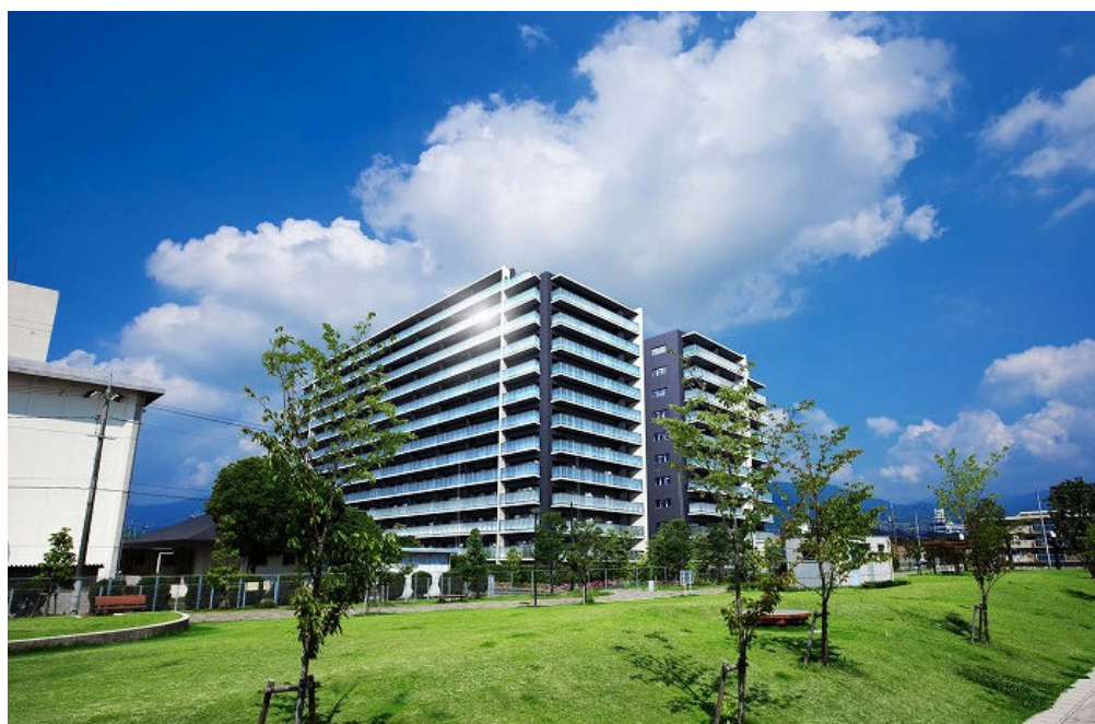
「シティハウス海老園マリーナコート」完成予想CG

総敷地面積6,300㎡超という広大な敷地は、東・南・北三方を道路に接し、南側に五日市南中学校、東側に五日市漁港緑地と五日市メイプルマリーナ、と建設建物の主開口部方向については、眺望・採光の『将来不安』の少ない施設に面した立地です。当敷地に対して、南向きを中心とした南棟と東棟を大胆に配棟しており、南棟のうち五日市南中学校の校舎より上層階においては、瀬戸内の海と宮島をはじめ瀬戸の島々を存分に望めるよう計画しました。