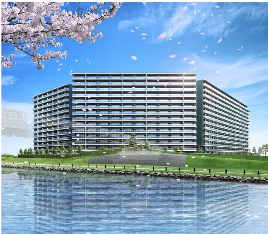
「AQURAS（アクラス）」完成予想CG

さらに、江戸川区は児童手当・子供医療費助成などの「子育て支援」が充実し、希望により「通学区域の学校」および「通学区域外から受け入れ可能な学校」を選択できる「学校選択制度」も採用しており、子育てには最適な環境が魅力です。