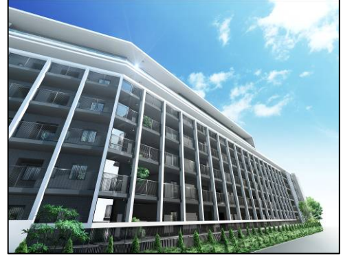
<建物完成外観予想図>