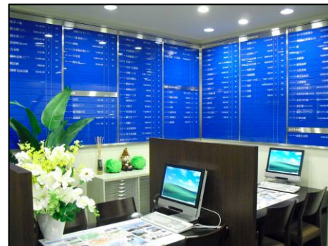
<コンシェルジュデスク>