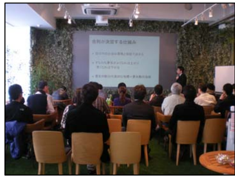
<セミナー開催イメージ>