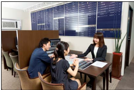
<コンシェルジュコーナー>

来場者は、初めて住宅購入を検討している 30 歳、40 歳代の会社員、特にこれから子育てを考えているディンクスが中心になっています。「総合マンションギャラリー」では、マンション購入に役立つ各種セミナーの開催や、“コンシェルジュコーナー”にて、昨今の金利変動、物件価格の先高感を背景とした住宅ローンのシミュレーション、物件価格の相場などのご相談を承っています。