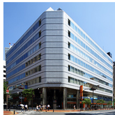
＜住友池袋駅前ビル＞