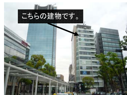
《パシフィックマークス川崎ビル》

【所在】 神奈川県川崎市川崎区駅前本町11-1 パシフィックマークス川崎ビル12F