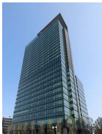
< 住友不動産渋谷ファーストタワー >