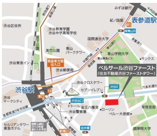
< 案内図 >