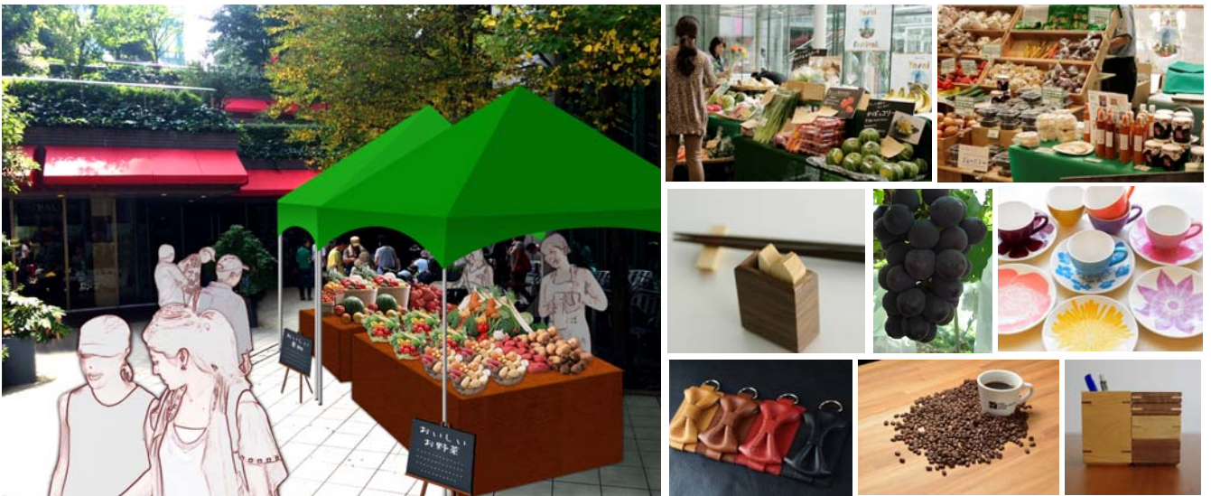
<秋空マルシェと商品イメージ>