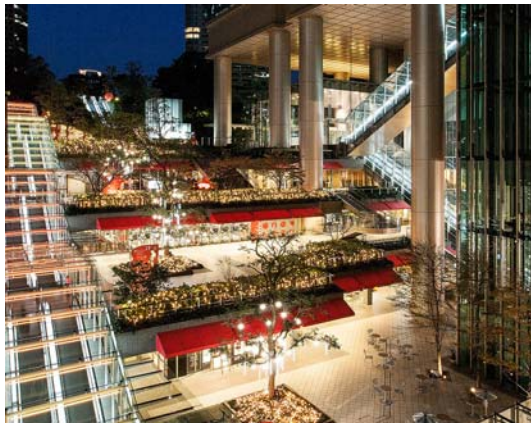
その他催し:クリスマスにちなんだ楽曲の演奏会実施