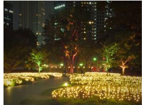
六本木三丁目東地区プロジェクト

＜シンボルツリーから広がる光の絨毯＞ 都会でありながら緑に癒される空間として設けられた庭園のシンボルツリーとなる約20mのクスノキを取り囲むように光の輪と庭園全体に広がる幻想的なイルミネーションの温かい光で、訪れる方々の心を癒す光の絨毯を演出。