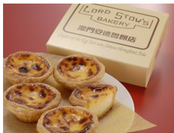
＜アンドリューのエッグタルト＞

この他にも素敵なスイーツ、ワインなど様々なお店が出店、販売を予定し、会場を賑わします。