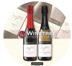
＜オーストラリアワインのシロメワイン＞