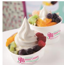
＜ゲーギース フローズンヨーグルト＞