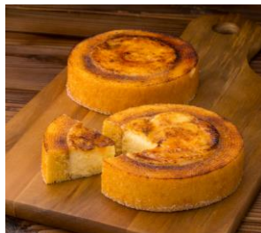
＜クリームブリュレバウム＞