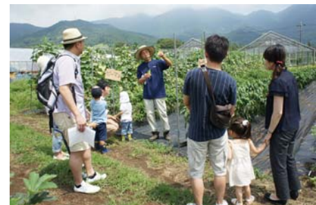
<体験イベントイメージ>

昨今“食の安全”や“自然志向の高まり”を受け、家庭菜園や市民農園の利用者が増えていますが、お住まいの近くで実現できる場が少ないのが実情です。住友不動産では、今年 3 月に完成した「シティハウス横濱片倉町ステーションコート」の徒歩圏に確保した農園において、“農園サービス”を提供し、居住者からご好評をいただいておりますが、今回は利便性をより一層高めるため、 県内で初めてマンション敷地内に居住者専用農園「ガーデンファーム」を用意いたしました。 様々な農作業や収穫体験イベントを通じてご家族のふれあいの場、食育の場としてお気軽にご利用いただけるほか、居住者同士のコミュニティ形成の場としてもご活用いただけるものと考えております。