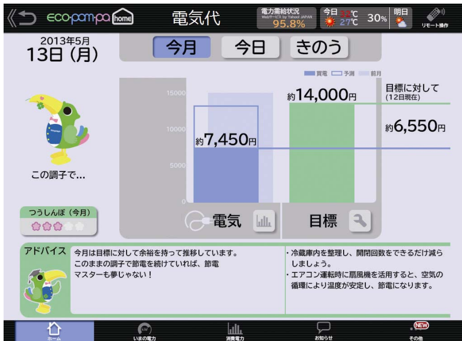
< 『わかる』 の一例：日立「エコポンパホーム」 >

全住戸に家庭内のエネルギー使用量をネットワーク上で管理、コントロールできる省エネ支援システム「HEMS」を導入しています。PCやスマートフォンなどで『見える』、累積電気代や目標に対する進捗などが『わかる』、外出先からも機器の操作が『できる』3つのステップで電気の効率的な使い方や省エネポイントをチェックでき、家族でエコライフを実践できます。