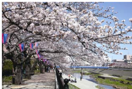
<柏尾川沿いの桜並木>