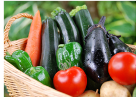
<無農薬野菜イメージ>