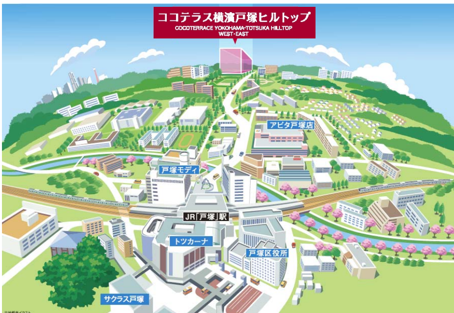
<駅周辺施設イメージマップ>

横浜の副都心である戸塚は、平成 24 年度に JR「戸塚」駅前の大規模再開発事業が完成し、生活利便性が一層高まっています。駅前には再開発で新たに誕生した「トツカーナモール」をはじめ、「サクラス戸塚」、「戸塚モディ」、「アビタ戸塚店」といった大型商業施設が集積しているほか、区役所・区民文化センター、各種金融機関や医療施設があり、日々の暮らしをサポートします。