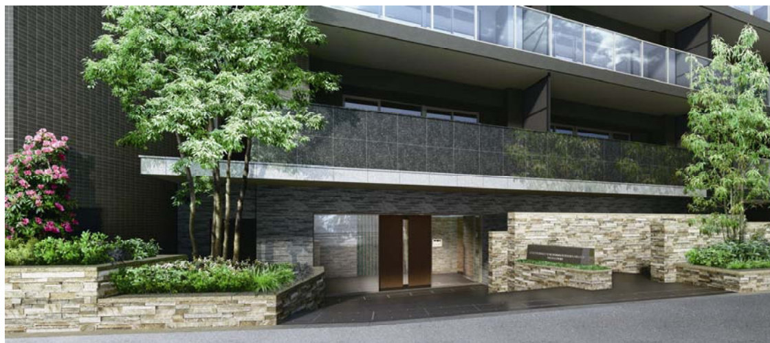
<ウエストエントランス完成予想図>

建物は白と黒のモノトーンを基調とし、精緻な美しさを感じられる洗練された外観デザインとしました。5年後、10年後の経年美化が感じられるよう、エントランス廻りを彩る大型の石調タイルやボーダータイル、バルコニーのガラスやステンレスなど、多彩で上質なマテリアルを採用し、周囲の緑にも映えるスタイリッシュな外観を生み出しています。