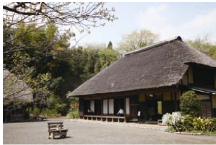
<舞岡公園 (園内古民家)>