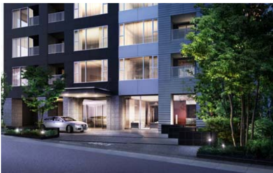
<エントランス完成予想パース>

都心タワーにふさわしく、優雅さを演出する車寄せのあるエントランスや荘厳な雰囲気の漂うエントランスホールが、重厚な迎賓の佇まいを創出しています。また、プライバシー性や防犯性、快適性の高いカーペット敷きの内廊下を採用し、ホテルライクな気品と落ち着きを演出しています。