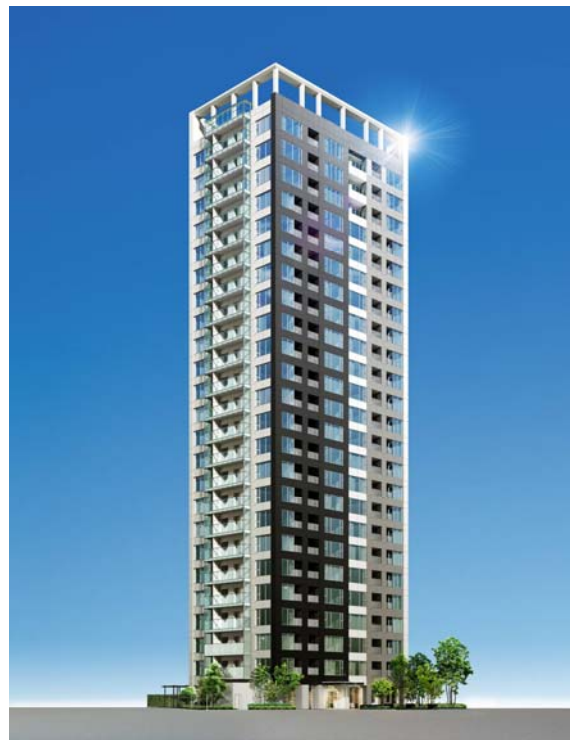
<建物外観完成予想パース>