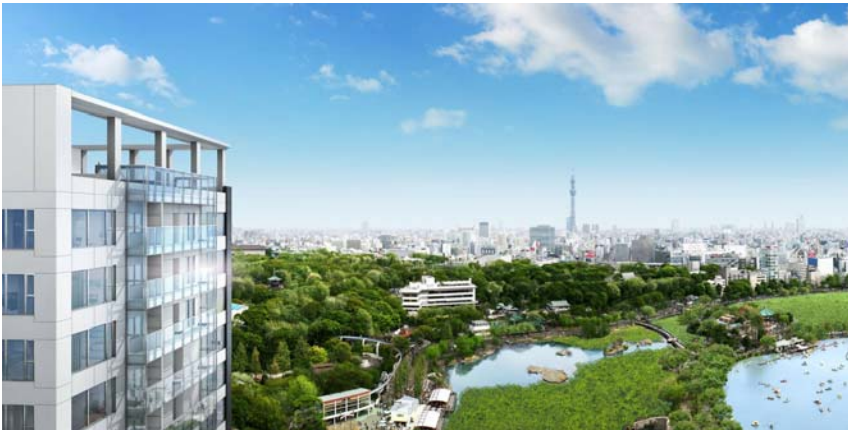
<外観完成予想図と「上野公園」周辺の合成>

山手線の内側という都心でありながら、眼下には潤いのある「不忍池」と豊かな緑に彩られた「上野恩賜公園」が望め、周辺には美術館や「東京大学」「東京芸術大学」等、歴史と文化、芸術が生まれ、多彩な魅力に満ちた環境です。都心ライフを自在に楽しめる「東京」駅約 3.5km 圏にあり、最寄りの東京メトロ千代田線「根津」駅へは徒歩 5 分、「大手町」駅まで直通で 6 分とビジネス街へのアクセスも良好です。また、新幹線や JR、地下鉄各線が乗り入れる「上野」駅、成田空港へダイレクトアクセスが可能な「京成上野」駅も徒歩圏にあり、ビジネスやレジャーに交通利便性の高いポジションです。