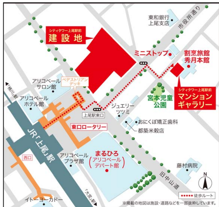
<現地周辺イメージ図>

「上尾」駅には“エキナカ”「イーサイト」、駅前には地元埼玉の百貨店「まるひろ上尾店」などのアリオベール各館や「イトーヨーカドー上尾店」といった大型商業施設が集積しており、本物件からはペDESTリアンデッキを通過して徒歩 2～4 分のダイレクトアプローチが可能です。さらに周辺には生鮮食品や日用品を幅広く揃えるスーパー「ビッグエー」や「いなげや」、「アップー通り商店街」があり日々の生活をサポートします。また、大型総合病院「上尾中央総合病院」をはじめとした各種医療機関や金融機関、市役所、図書館、小学校などの公共施設が身近に揃っており、安心して便利な生活を享受できる立地といえます。