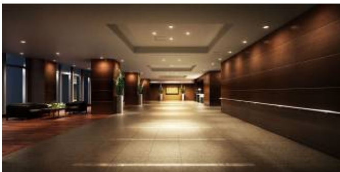
<エントランスホール完成予想図>

建物内部もランドマークタワーに相応しい設備・仕様を採用しています。マンションの顔となる「エントランスホール」は、趣のあるタイル貼りナチュラルな木の風合いを組み合わせたフロア仕上げとし、木目調のウォールと化粧を施した柱、開放的な折上げ天井を施しました。「重厚」と「優雅」が融合し、ホテルのような佇まいの迎賓空間が広がります。