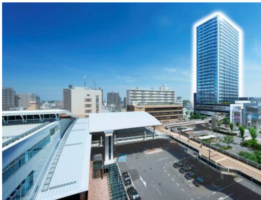
＜「上尾」駅前と建物外観完成予想図＞

「シティタワー上尾駅前」は、上尾市の玄関口にふさわしい魅力と賑わいの創出、都市防災の強化を図るために開発が進められている「上尾中山道東側地区第一種市街地再開発事業」の中核を成すランドマークレジデンスとして誕生します。再開発事業で新たに生まれ変わる街は「A-GEO(エージオ)タウン」と名付けられ、「住宅」、「商業施設」、「オフィス」を複合的に整備することで、市民生活の向上、地域の活性化を実現し、魅力ある市街地を形成することを目的としています。