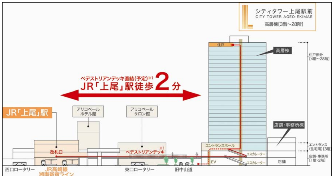
<ペDESTリアンデッキ直結イメージ図>

「上尾」駅からは、湘南新宿ライン利用で「大宮」駅に 1 駅 8 分、「池袋」駅 30 分、「新宿」駅 37 分のダイレクトアクセスが可能です。また、高崎線の利用で「浦和」駅へ直通 17 分、「上野」駅まで直通 36 分、さらに平成 26 年度中には「東京」駅まで延伸が予定されており、主要なビジネスエリアへスマートにアクセスできる交通利便性に優れた立地です。