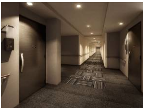
<内廊下完成予想図>

共用廊下部分は足音が響きにくいカーペット敷きで、空調も完備したホテルライクな「内廊下設計」を採用しています。廊下に面した窓を設けないことにより、外部からの進入経路が限られ、プライバシーを守り、防犯性も高めています。また、4階には屋上緑化スペースと連続した屋上テラスを設置、自然の光や風を感じながらくつろげる住む方のためのスペースとしてご利用いただけます。これらの共用部、共用施設は邸宅の品格を高め、日々の暮らしを豊かに彩ります。