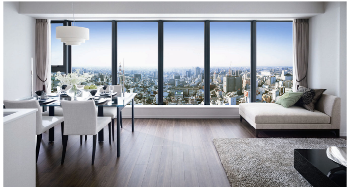
<ダイナミックパノラマウィンドウ>