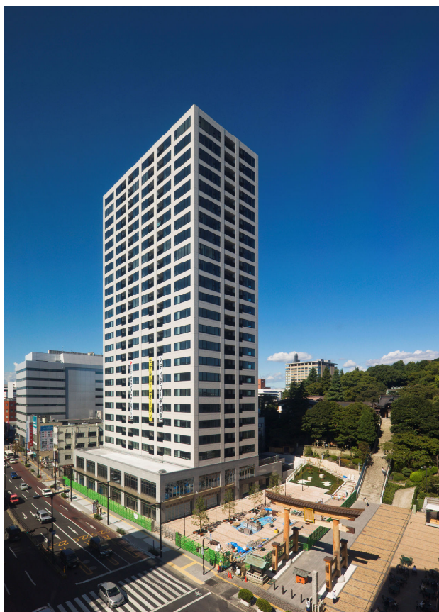
＜「シティタワー宇都宮」外観（右側は二荒山神社）＞

※地上24階建ては平成12年1月～平成22年3月の11年間に宇都宮市内で供給された、民間分譲マンションでは最高層となります。 (平成22年3月現在MRC調べ)