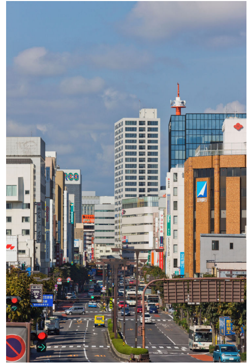
<JR宇都宮駅周辺から中心市街地方面>