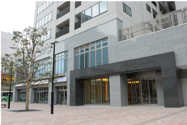
<マンションエントランス周辺>

城郭の大手門をモチーフにした風格ある石貼りのエントランス、高さ最大3mの開放感のあるエントランスホール、そして各住戸へとつながる廊下は冷暖房を完備したカーペット敷きの内廊下を採用しています。高級ホテルを思わせるグレード感溢れる仕様は、お住まいになる方々の満足感を高めます。