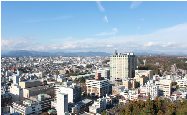
<24階より北西方面の眺望(栃木県庁側)>

足元近くから天井近くまで広がる2.2mのダイナミックパノラマウィンドウを通して、室内からの眺望をご堪能いただける「ダイレクトスカイビュー」仕様となっています。また、ダイナミックパノラマウィンドウには断熱性を高めるためにペアガラスを採用し、さらに透明日射調整フィルムを貼るなど、紫外線対策にも配慮しています。