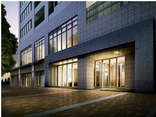
エントランス外観

高さ10m、幅21mの城壁のような風格ある石貼りのエントランスは、白を基調とする天然みかげ石の艶に落ち着いた輝きをもつ黒の天然みかげ石をゲート状に配した意匠で、城郭の大手門をモチーフにしております。一步足を踏み入れると、開放感のある、高さ最大3mのエントランスホールがあり、エントランスラウンジは、ナチュラルシックな家具を贅沢に配置しております。