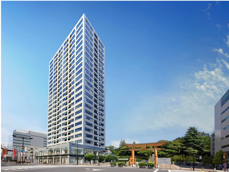
「シティタワー宇都宮」完成予想イメージ図（敷地外、二荒山神社を含む）

※ 地上24階建ては1999年1月～2008年12月の10年間に宇都宮市内で供給された、民間分譲マンションでは最高層となります。 （平成21年3月現在当社調べ）