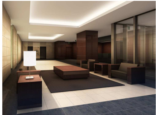
エントランスラウンジ