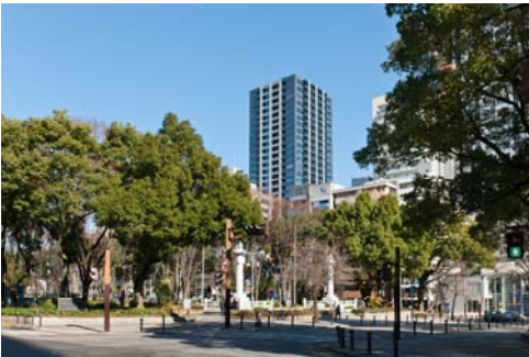
<久屋大通公園から望む>

緑溢れる都心のオアシス「久屋大通公園」に近接している“泉一丁目”は住宅地としても人気の高いエリアです。中高層住宅が立ち並ぶ中にハイセンスなショップやオープンカフェなどが点在し、休日の散策やショッピングが生活に潤いとゆとりを与えます。また、徒歩 10 分圏内に幼稚園、小学校、中学校があり、子育てにも優しいポジションです。