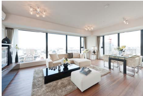
<ダイナミックパノラマウィンドウ・例>