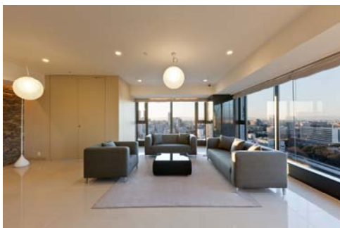
<泉スカイラウンジ>

マンションの顔となるエントランスホールは、天井高約5mの開放的な2層吹き抜けの空間とし、2階には待ち合わせや商談など、多様な用途でお使いいただけるオープンスペース「泉サロン」、20階には官庁街や名駅方面の眺望が楽しめる「泉スカイラウンジ」(有料施設)を迎賓の場としてご用意しました。また、プライバシー性・快適性の高い内廊下を採用するなど、共用部はホテルライクな設えを施しています。