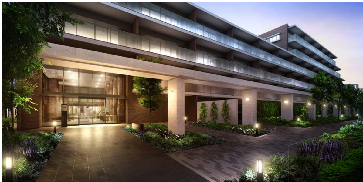
<テラスCエントランスとパーゴラ完成予想図>