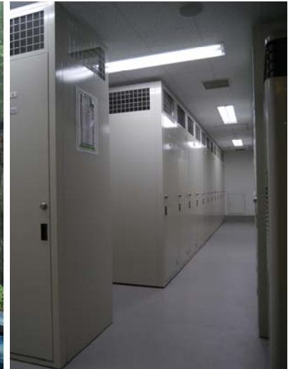
<トランクルーム・イメージ>