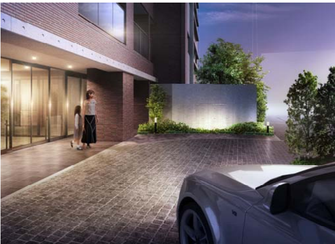
<車寄せのあるテラスAエントランス・完成予想図>