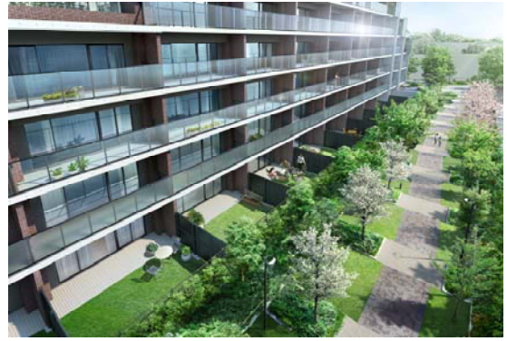
<専用庭と公園3号・完成予想図>