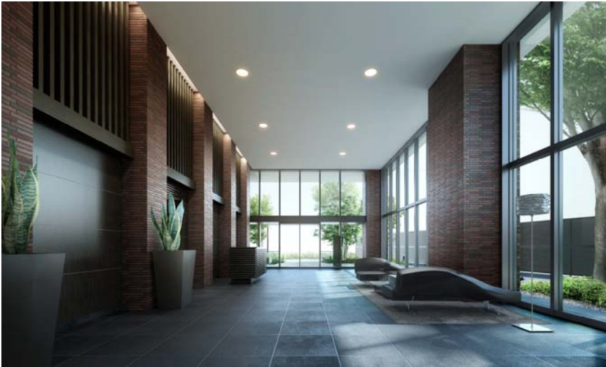
<テラスCエントランスホール・完成予想図>