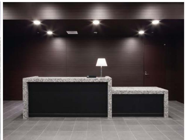
<コンシェルジュカウンター・イメージ>