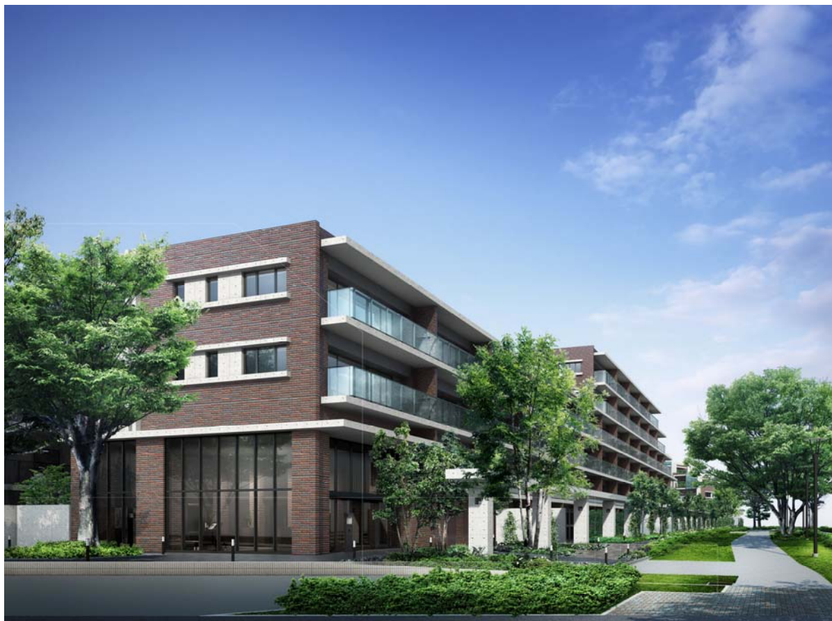
<テラスC完成予想図>

さらに、格調高いエントランスや、直線的なラインのコンクリート打ち放しに灯りを設えたパーゴラが創り出す優美な空間が邸宅としての存在感を高めています。