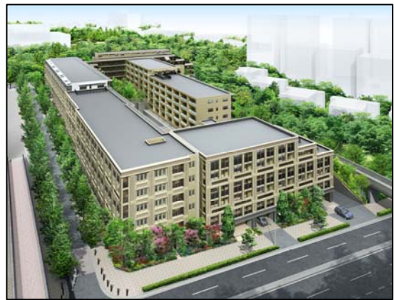
＜建物配棟イメージ＞

総敷地面積約 12,000 m 2 の広大な敷地を活かし、空地率 56%のゆとりある配棟計画を実現しました。5棟をコ型に配置することで南向き住戸を数多く設定し、良好な通風・採光と開放感を確保しています。また、敷地面積の約 3 割を確保して 2 つのプライベートガーデン（庭）を設けるなど、敷地内には四季の移ろいを感じさせる多彩な花や樹木を植樹し、隣接する茅ヶ崎公園との緑の連続性を取り入れつつ、開放感を最大限に創出するランドスケープです。