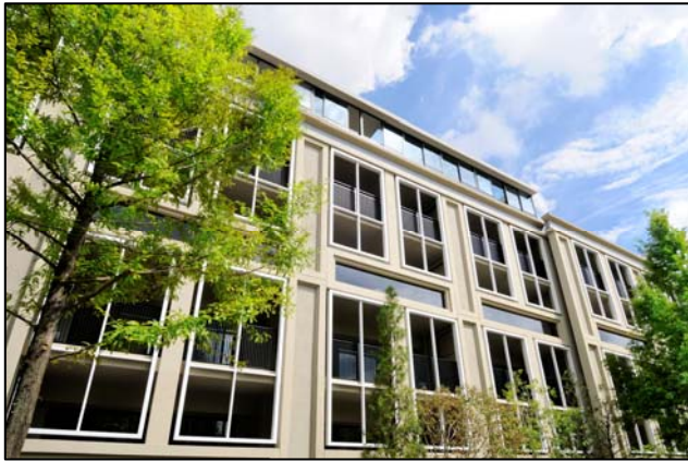
＜特徴的なグリッドデザイン＞

ファサードは柱・外壁・窓枠にいたるまで立体的な造形を意識しました。壁面は、窓枠と柱で構成されたグリッドデザインにより、2層分が1層に見える特徴的なデザインを採用し、基壇部には天然石を張り、建物の重厚感を演出しています。深く刻まれた彫、味わいを深める素材、微にこだわり美を磨いた外観デザインは、ヨーロッパの由緒ある洋館のように洗練された雰囲気を感じ、時を経る程に、クラシカルな価値を深める建築を目指しています。港北ニュータウンの美しい街並みと周囲の緑に調和した個性的なデザインは、お客様から高くご評価いただいております。