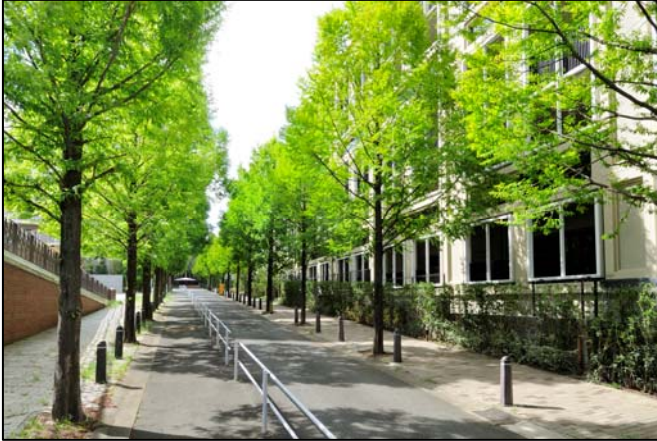
<敷地南側の並木道>

都市機能と自然が調和した街「港北ニュータウン」は、横浜市内でも人気のエリアです。なかでも本物件が位置する「仲町台」は、“自然と人間の調和”をコンセプトにした街づくりが進められており、豊潤な自然に抱かれながら穏やかな時を育む住宅街です。