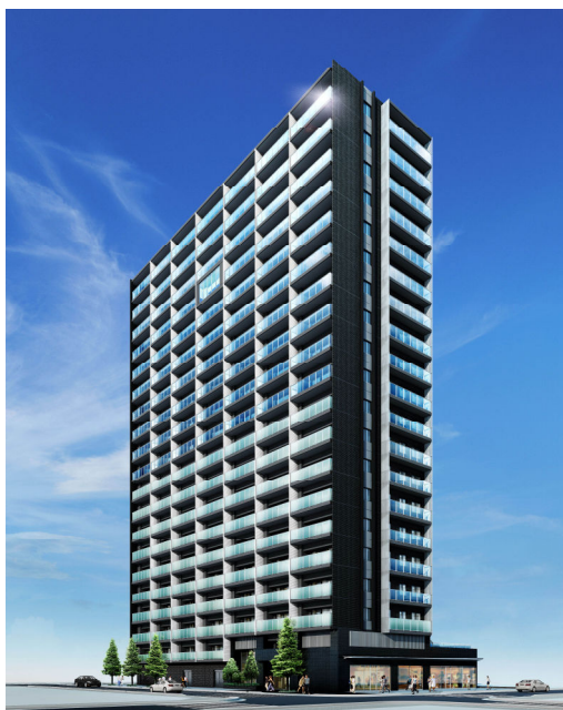
＜建物外観完成予想パース＞