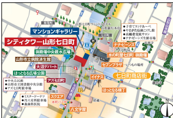
＜現地周辺イメージ図＞