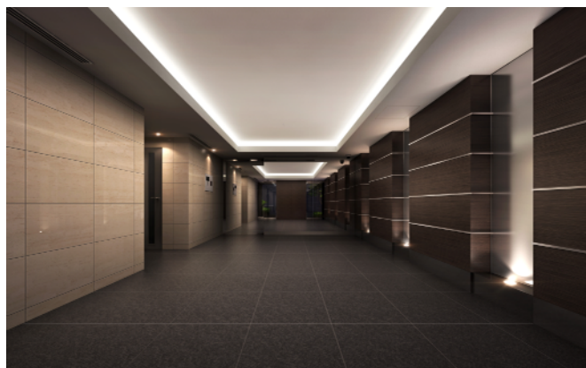
<エントランスホール完成予想パース>

第一種低層住居専用地域の落ち着いた街並みに調和する低層3階建ての建物は、スタイリッシュで格調高い邸宅の趣きを醸し出します。グレーのボーダータイルを基調に縦ラインには白のアクセント、水平ラインにはコンクリート打放し塗装を取り入れた彫の深い幾何学ラインに、ガラスという異なる要素を組み合わせた個性的な外観デザインです。また、エントランスホールはファサードと調和する素材と折り上げ天井で構成された空間に設え、共用廊下もホテルライクな落ち着きのある内廊下仕様としました。