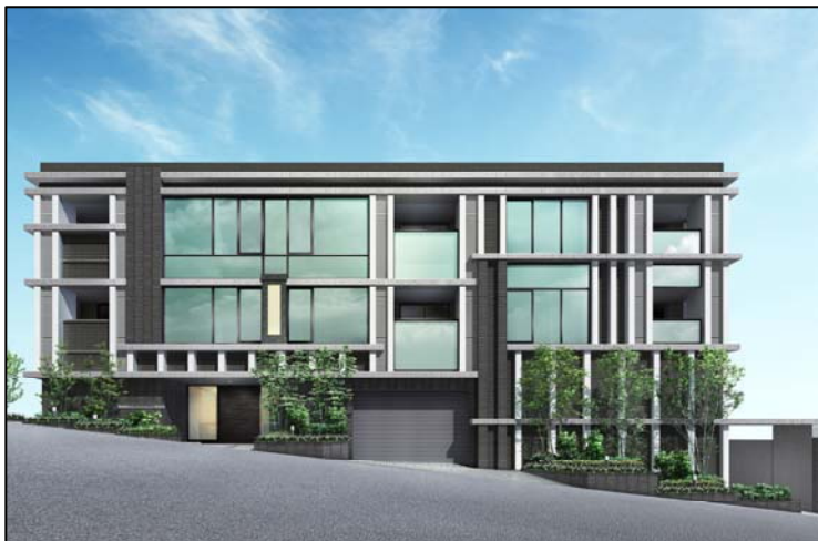
<建物完成予想パース(南側)>

住友不動産株式会社（本社：東京都新宿区西新宿 2-4-1、代表取締役社長：仁島浩順）は、このたび住宅地として人気の高い東京都文京区小日向に建設中の低層レジデンス「シティハウス文京小日向」（地上 3 階・地下 1 階、総戸数 38 戸）の第 1 期販売住戸の登録受付を行い、全戸完売（登録即完）いたしましたのでお知らせします。お客様からは、“小日向アドレス”の立地や 個性的なランドスケープ などについて高い評価をいただいています。