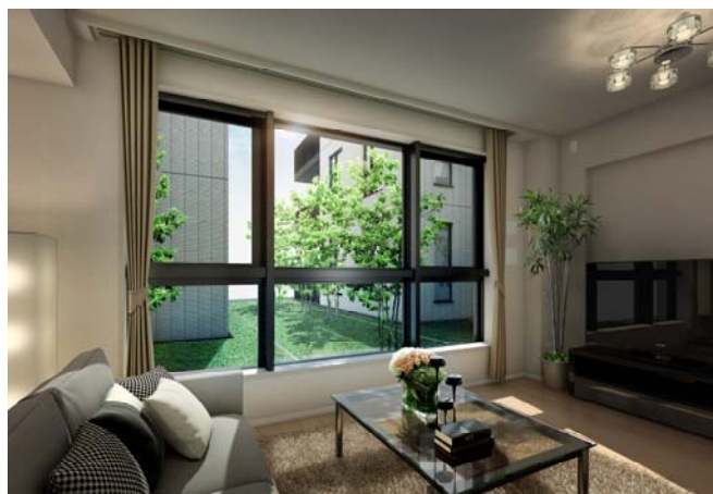
<中庭に臨むリビング：イメージパース>

住戸間に3つの中庭を設けることで、ほとんどのプランが通風と採光に優れ、開放感のある角住戸（約94%）を実現しています。内廊下で結ばれた住戸は、まるで“離れ”のような落ち着きと独立性を持ち、それぞれの住まいからは坪庭のように趣きのある中庭の景観を眺めることができます。また、歩行者と自動車、自転車の出入り口をそれぞれ分けた歩車分離設計を採用するとともに、駅へのアプローチに便利なサブエントランスを設けるなど、居住者の安全性と利便性にも配慮しています。