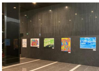
オフィスエントランスのアート展示イメージ

当社グループは、事業活動を通じた社会課題解決の取り組みの一環として、障がいのある人にとって働きやすいオフィス環境の整備など、障がい者活躍の場の創出に努めてまいりました。その中で、TOPPANホールディングスの「障がい者への一方的な支援に留まらず、ビジネスパートナーとして持続可能な取り組みを構築していく」という考え方に賛同し、本プロジェクトへの参画を開始しました。当社への来訪者をお迎えするエントランスロビーをアートで彩ることで、就労環境や美観の向上も図っています。