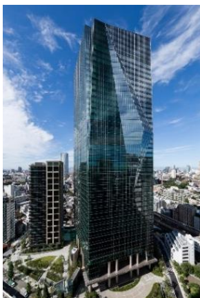
住友不動産六本木グランドタワー