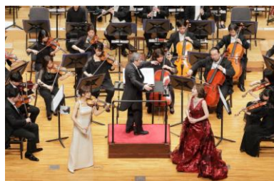
『第116回クリスマスステップコンサート(大阪公演)』 千住 真理子氏、森 麻季氏の共演