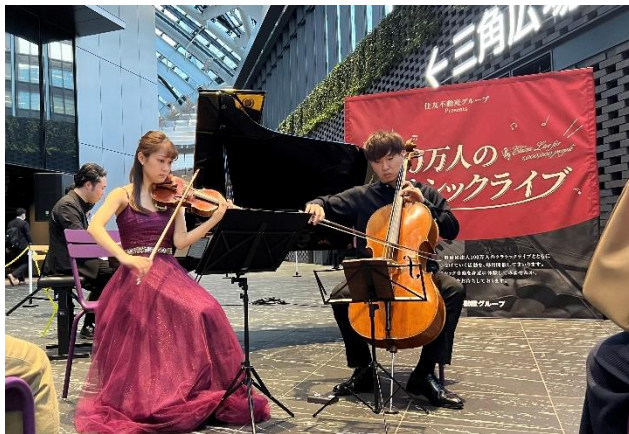
ピアノ・ヴァイオリン・チェロの演奏が間近で楽しめる

今後、本公演を皮切りに「新宿住友ビル 三角広場」のほか、「住友不動産六本木グランドタワー」、「羽田エアポートガーデン」の3施設において、2025年3月までに合計36回の開催を予定しております。