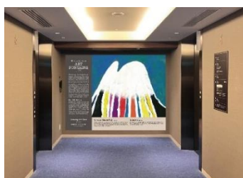
ホテルエレベーターホールの展示イメージ