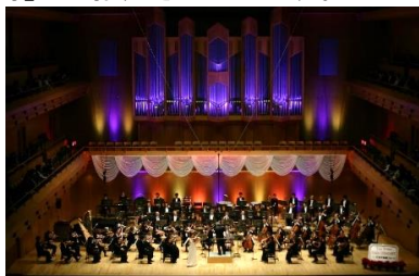
『第115回クリスマスステップコンサート(東京公演)』 千住 真理子氏と新日本フィルハーモニー交響楽団の演奏

本格的なクラシックコンサートを誰でも一緒に楽しめるよう、全席無料でお客様をご招待する「ステップコンサート」。国内外で活躍する指揮者や演奏家、オーケストラを迎え、1987年の第1回開催から30年以上開催を続け、累計26万人超の方々にクラシック音楽をお届けしています。本コンサートは児童福祉向上のための特に優れたコンサートであるとの評価から、1996年より「厚生労働省 社会保障審議会特別推薦 児童福祉文化財」にも指定されています。