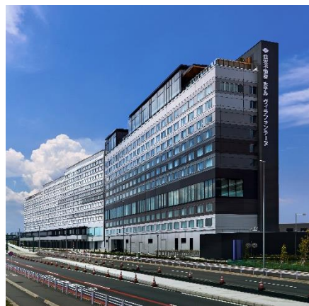
羽田エアポートガーデン