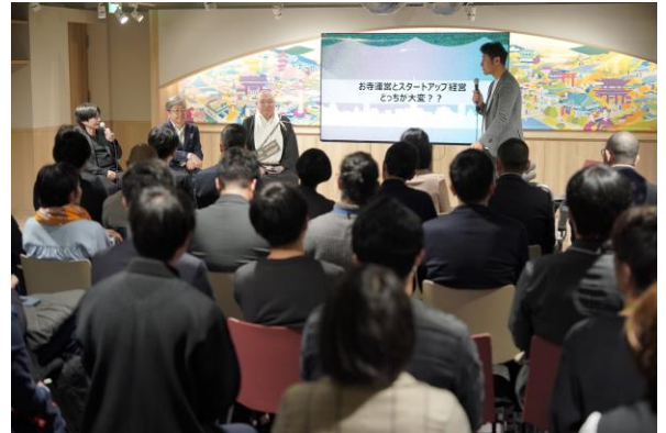
KYOTO Innovation Studio Session Vol.8 の様子