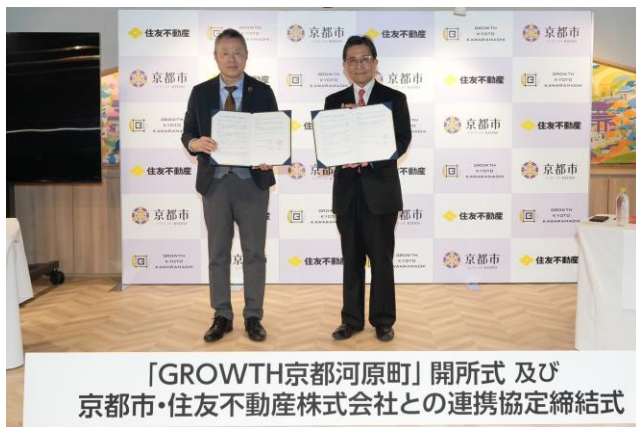
「GROWTH京都河原町」開所式 及び 京都市・住友不動産株式会社との連携協定締結式

本施設の開業に先立ち、2024年3月25日(月)にオープニングセレモニーを実施いたしました。セレモニーでは、京都市と住友不動産における連携協定書の締結式のほか、京都市が主催するイベント「KYOTO Innovation Studio Session Vol.8」やオープニングパーティが開催されるなど、京都の経済やスタートアップ・エコシステムの持続的な発展に寄与する施設として華々しいスタートとなりました。