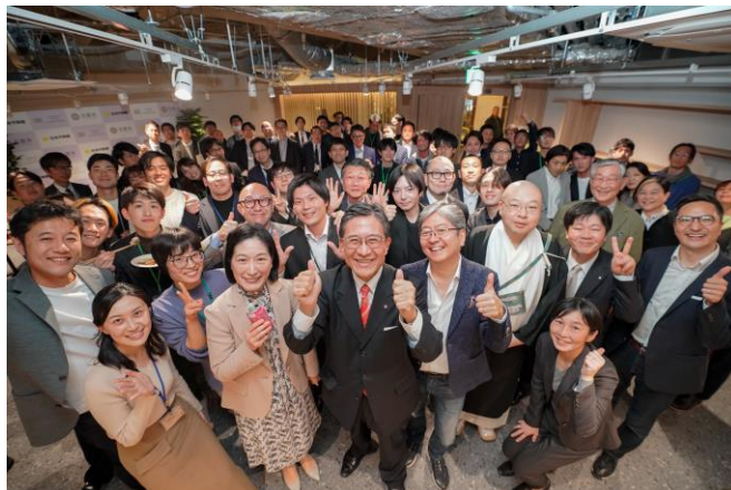
オープニングパーティーの様子

参加者からも「四条河原町の立地を活かして多様な人々が集まっていた」などご評価いただき、当施設が今後担っていく「交流拠点」としての役割に対しても期待の声が寄せられていました。