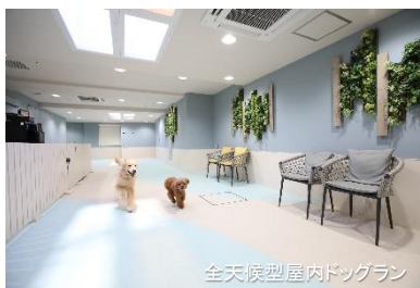
全天候型屋内ドッグラン