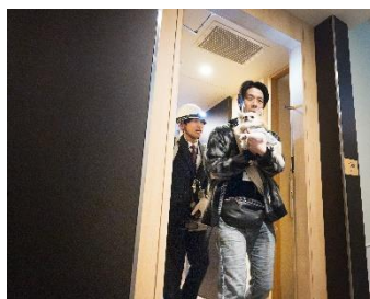
客室から避難する様子