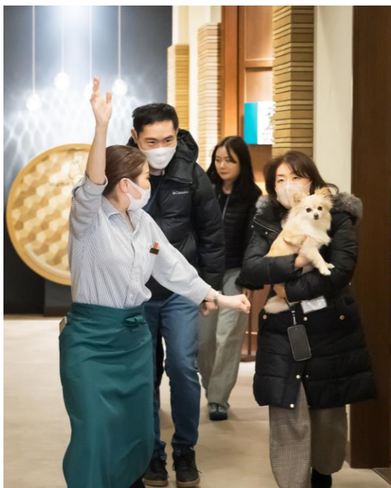
レストランからの避難誘導の様子

当社は、世界各地からお客様が訪れる都心のホテルチェーンとして、快適な滞在空間・サービスのご提供に加え、これからも「安心・安全」なおもてなしに努めて参ります。