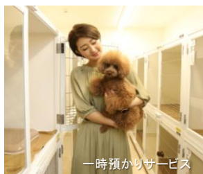
一時預かりサービス