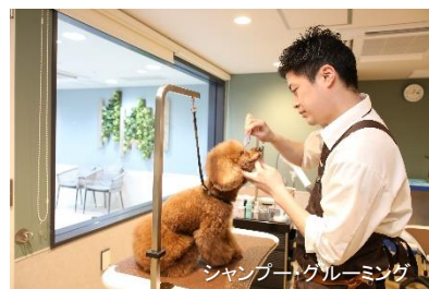
シャンプー・グルーミング