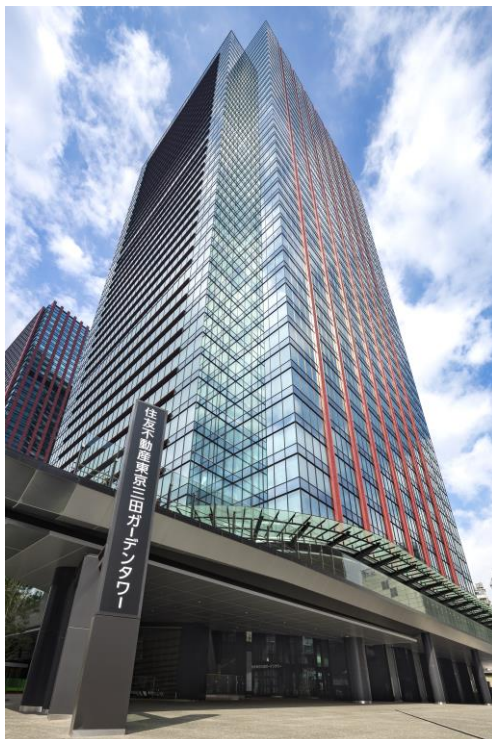
住友不動産東京三田ガーデンタワー 外観

当社は、今後もオフィスビル事業やマンション事業、ハウジング事業など様々な事業領域において、「環境・社会に配慮した性能」を有する価値の高い社会資産を創造し、より一層持続可能な社会の実現に貢献してまいります。