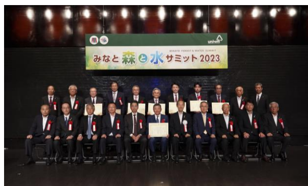
「みなとモデル二酸化炭素固定認証制度」表彰式 集合写真