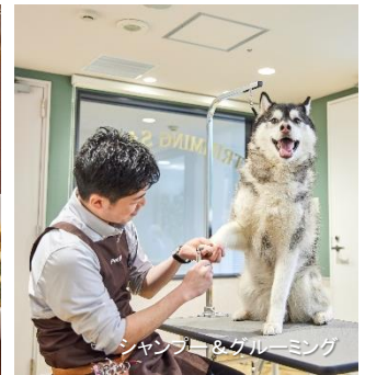
シャンプー&グルーミング