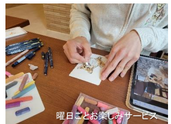
曜日ごとお楽しみサービス