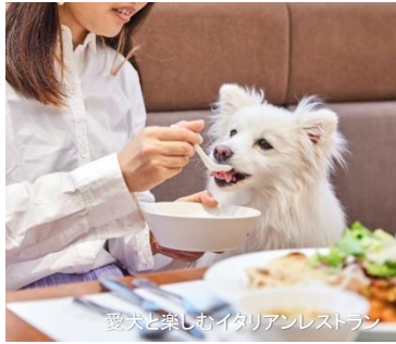
愛犬と楽しむイタリアンレストラン

東京タワーに程近い芝公園エリアに位置するinumo芝公園は、館内どこでも愛犬とリードで歩ける愛犬ファーストなホテルです。屋内ドッグランをはじめトリミングサロン、一時お預かりサービス、愛犬の料理が調理できるキッチンをはじめ、愛犬と入れるイタリアンレストランも併設。平日限定でプロカメラマンによる写真撮影やライブドローイングのイベントも開催しています。