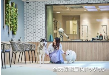
全天候型屋内ドッグラン