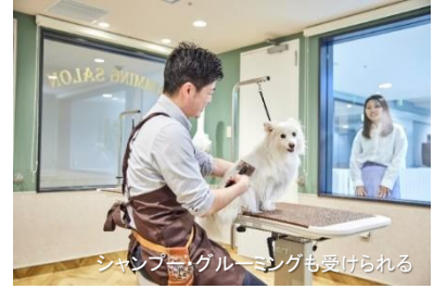
シャンプー・グルーミングも受けられる