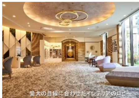
愛犬の目線に合わせたインテリアのロビー