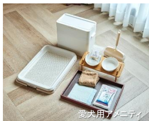
愛犬用アメニティ