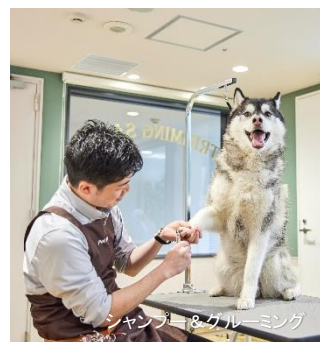
シャンプー・グルーミング