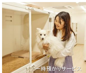
1時間預かりサービス