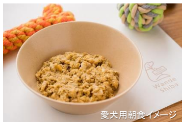
愛犬用朝食イメージ