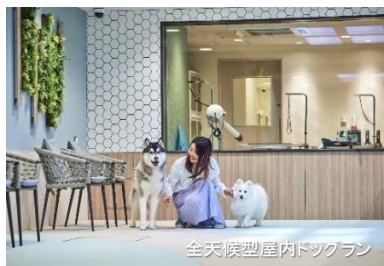
全天候型屋内ドッグラン