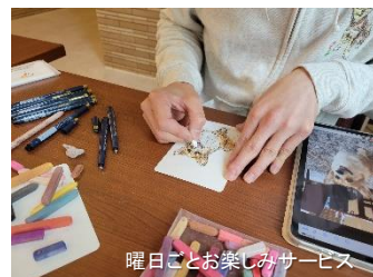
曜日ごとお楽しみサービス