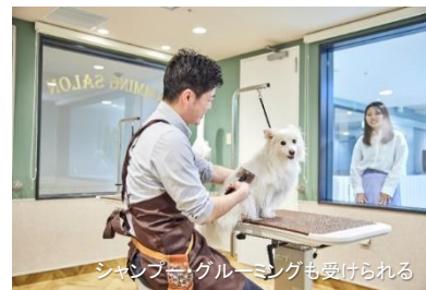
シャンプー・グルーミングも受けられる