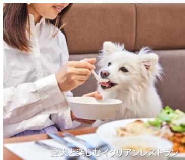
愛犬と楽しむイタリアンレストラン

東京タワーに程近い芝公園エリアに位置するinumo芝公園は、館内どこでも愛犬とリードで歩ける愛犬ファーストなホテルです。屋内ドッグランをはじめトリミングサロン、一時お預かりサービス、愛犬の料理が調理できるキッチンをはじめ、愛犬と入れるイタリアンレストランも併設。平日限定でプロカメラマンによる写真撮影やライブドローイングのイベントも開催しています。