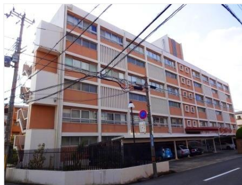
「浜芦屋マンション」 兵庫県神戸市/1964年分譲 6階・28戸・鉄筋コンクリート造