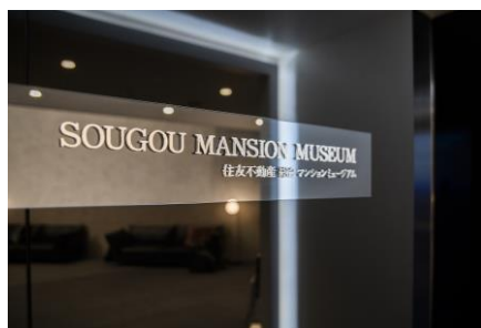
総合マンションミュージアム入口のロゴ