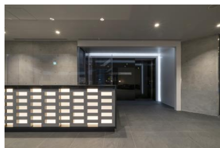
総合マンションミュージアム受付 (東京汐留ビルディングB2階)