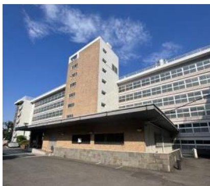
「目白台アパート」 東京都文京区/1962年完成 8階・127戸・鉄筋コンクリート造