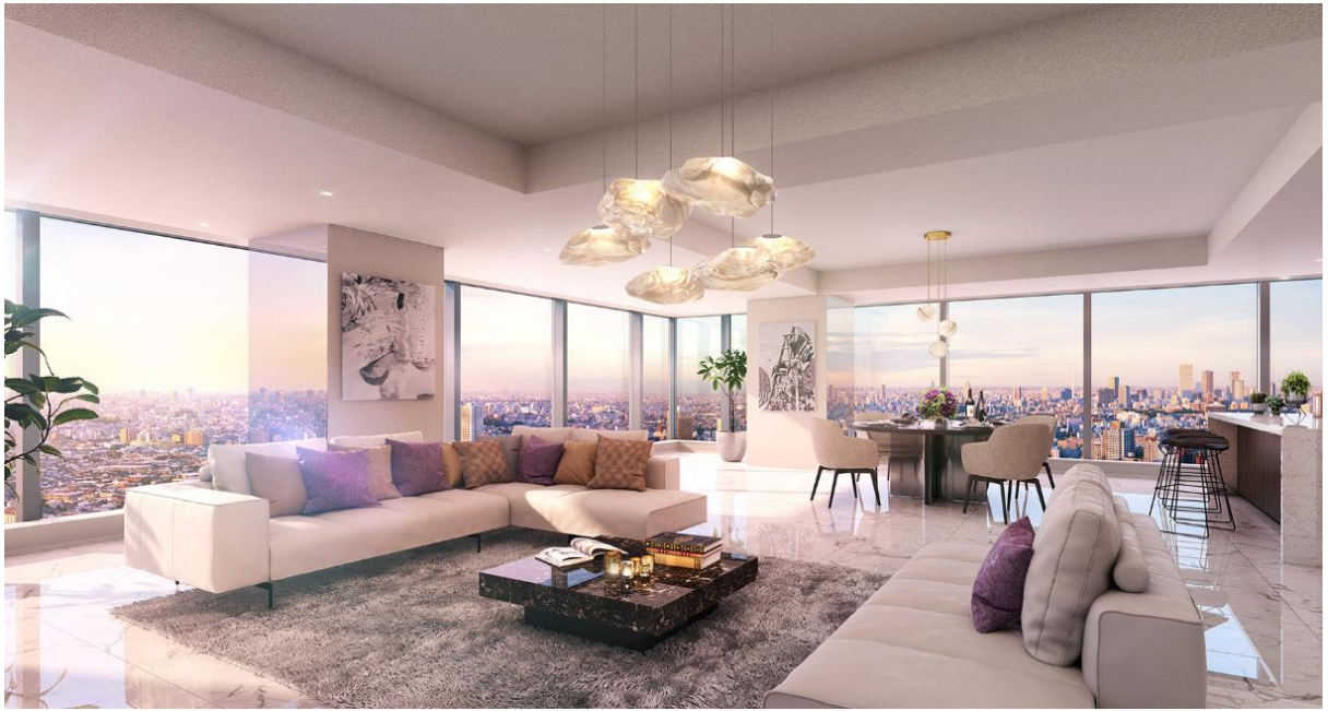
＜ラ・トゥール新宿ファースト完成予想図 : Type260-A/262.75㎡/2Bedroom＞