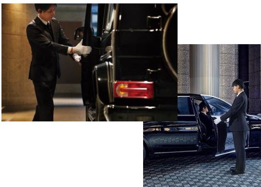
＜ヴァレーサービスイメージ＞

24時間常駐するバイリンガルコンシェルジュが、タクシー配車、宅配物の一時預かり(冷蔵・冷凍含む)のサービスに加え、来訪者の一時対応(レセプションサービス)を全て行い、お客様のプライバシーをお守りします。当社物件におけるヴァレーサービス導入は新宿エリアでは初となります。