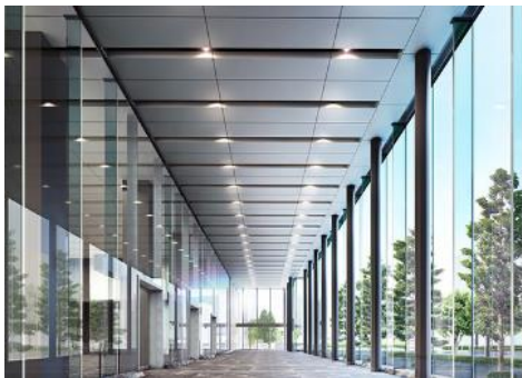
<天井高約8mのアトリウム完成予想図>