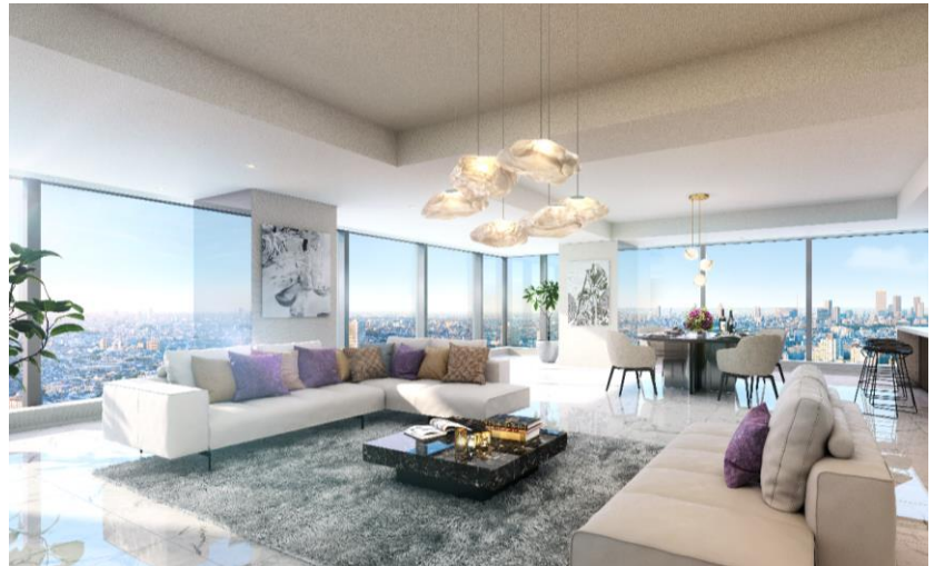
<ラ・トゥール新宿ファースト内観完成予想図>