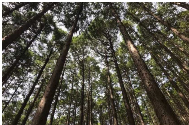
「住友不動産の森」主伐再造林を行うヒノキ樹林

林野庁「森林・林業統計要覧2022」 Canadian Council of Forest Ministers「National Forestry Database」 を引用し、再造林率=人工造林面積÷立木伐採面積にて算出