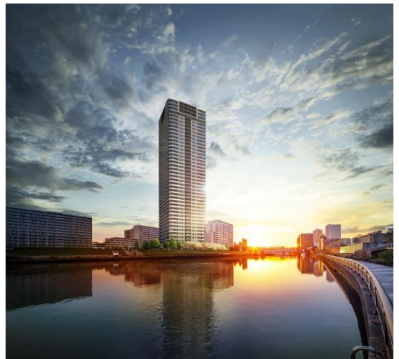
シティタワー千住大橋 外観完成予想図

今後もお住まい探しが楽しくなる総合マンションギャラリーとなるよう、マンション販売に関するあらゆる情報を効率的にご案内できる環境を整えて、お客様の満足度の向上に努めてまいります。