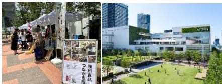
商業施設でのマルシェ等