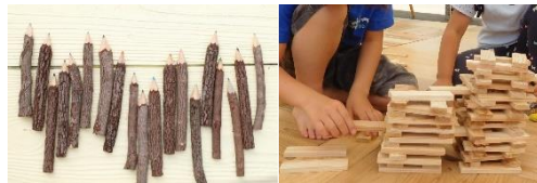
木育活動 ※画像はイメージです。

都会の子どもたちに楽しく地球環境について考えるイベントを開催（木育ワークショップ、国産材・間伐材を使用したノベルティグッズの作成）などを行います。