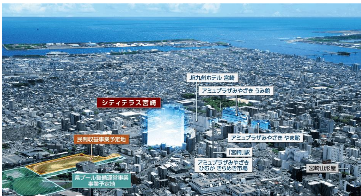
宮崎駅周辺開発及び、物件立地イメージ

本プロジェクトでは、ホテルライクな車寄せや2層吹抜けの開放感あるエントランスホールを設けることで迎賓空間を演出、また全戸南向き住戸にする等、快適な都市生活を追求するランドプランとしております。なお、当社が県内における大規模開発を行うのは初めてとなります。