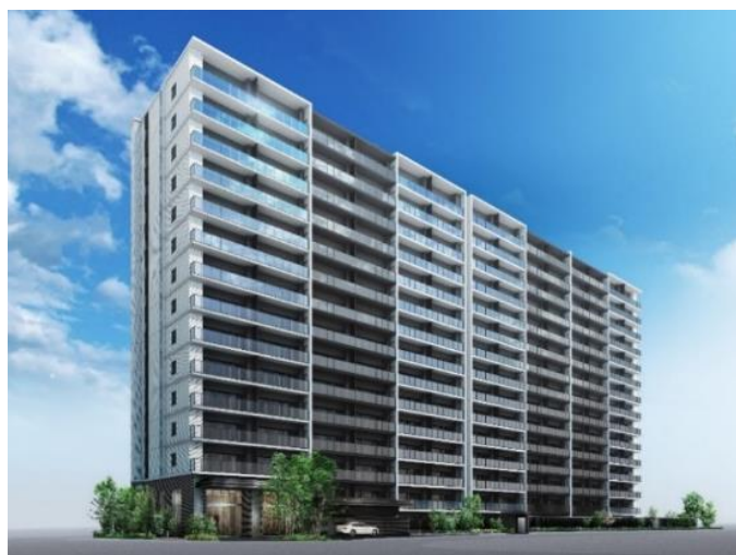
外観完成イメージ

共用部に設置された防犯カメラや、エントランスホール前のオートロックなどのセキュリティが、住まう方々の安心と安全を守ります。