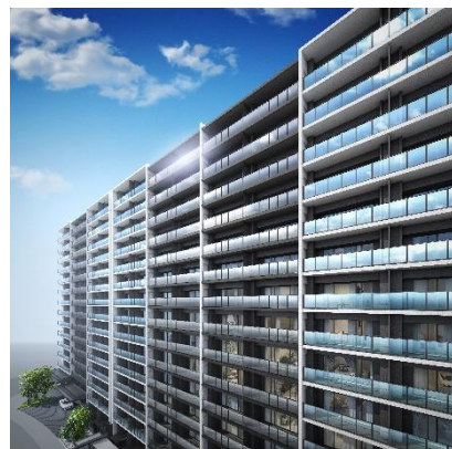
外観完成イメージ