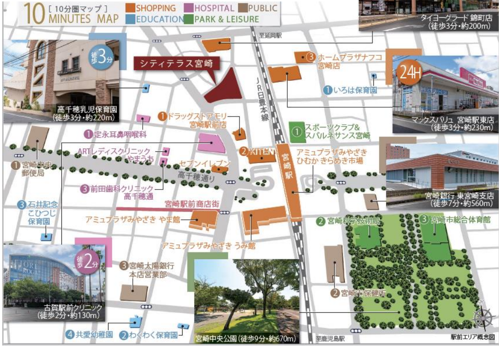
駅前エリア概念図

宮崎駅周辺は都市機能が進化し、利便性の向上が期待できるエリアです。新たな大型商業施設を中心に、生活を支える施設が集約。公園や文化施設、スポーツクラブ、病院、子育て施設も充実しています。