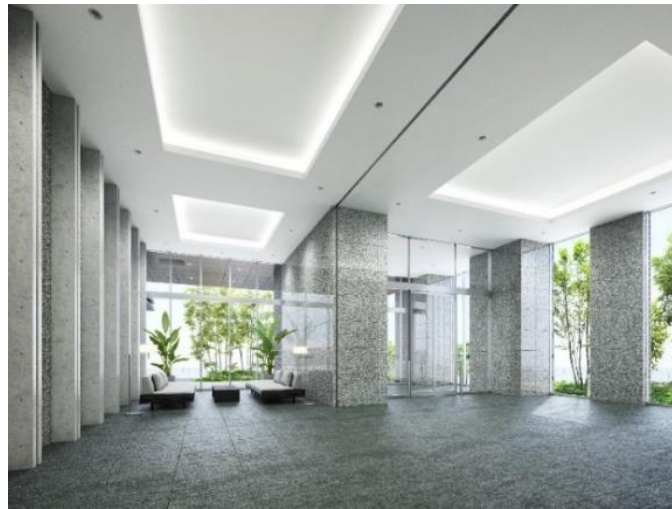
エントランスホール ラウンジイメージ