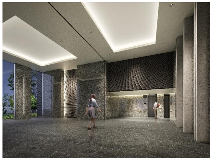
エントランスホール イメージ