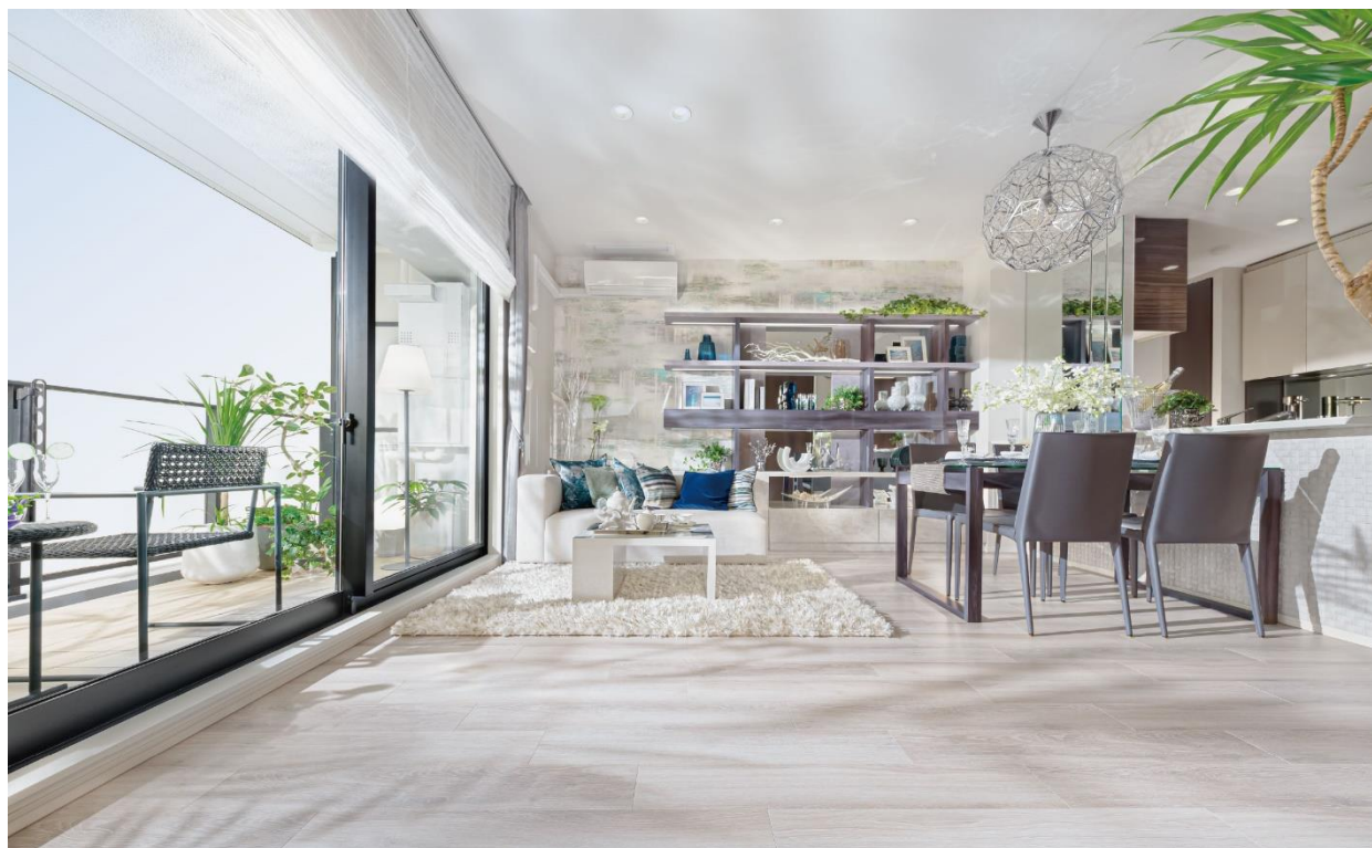
<リビング・ダイニング>

天井高最大約2,450mm～2,650mm(一般的な物件は2,400mm)を確保、躯体柱をリビング・ダイニングの外に出したアウトフレーム設計を採用。室内のスペースを有効に活用できる設計にしています。また、キッチンには生ゴミを粉碎処理してゴミを減らしてくれる「生ゴミディスポーザー」や「食器洗い乾燥機」はもちろん、雨の日の洗濯時に便利な浴室暖房乾燥機や床暖房などの設備が充実しています。