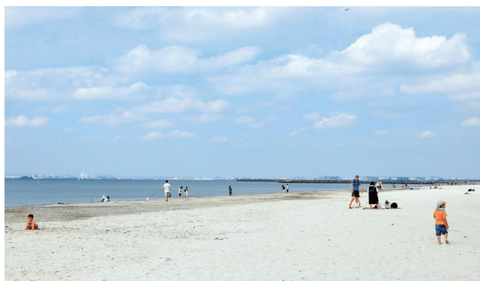
<いなげの浜・徒歩23分>