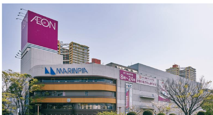
<イオンマリンプピア店・徒歩7分>