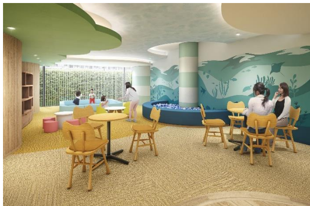
＜キッズルーム完成予想図＞