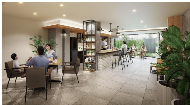
＜パーティールーム完成予想図＞