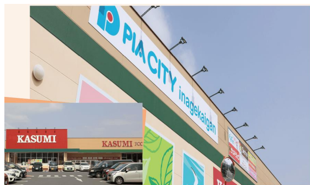
<ピアシティ稲毛海岸・徒歩4分>