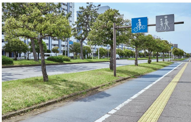
<海浜松風通り・物件現地より徒歩1分>

自然だけでなく、大型複合施設「ピアシティ稲毛海岸」や「イオンマリンプピア店」をはじめ、保育園・小学校や病院、薬局、公園など日常の暮らしに便利な施設が徒歩10分圏内に揃っており大変便利な住環境です。