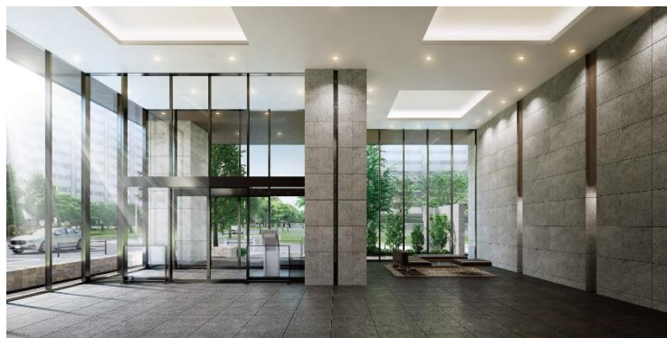
＜エントランスホール完成予想図＞