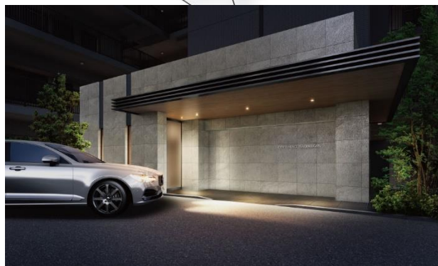
＜車寄せ完成予想図＞