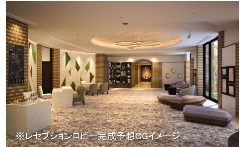
※レセプションロビー完成予想CGイメージ

愛犬の視線の高さに合わせたインテリアが迎えるレセプションロビーから愛犬との旅がはじまります。ロビーではワンちゃん好きのスタッフがお出迎えし、滞在中のお手伝いをさせていただきます。また、館内すべての場所で愛犬が歩き回れる※1ことを可能としています。