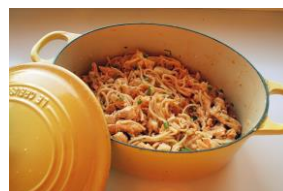
ポークひき肉のチーズトマトパスタ