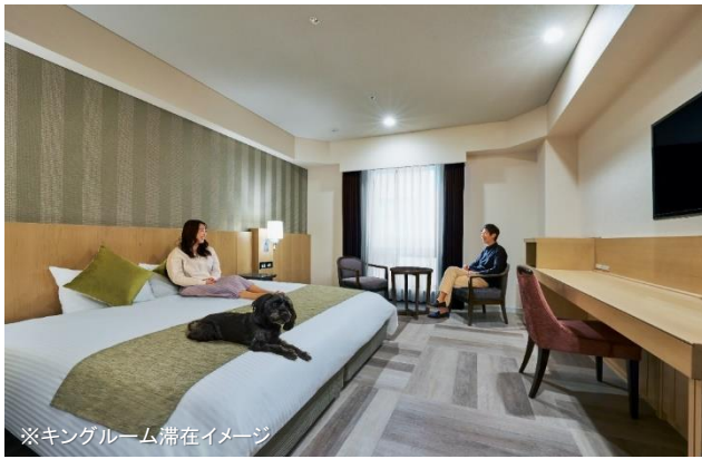
※キングルーム滞在イメージ