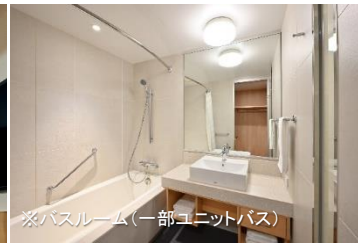
※バスルーム(一部ユニットバス)