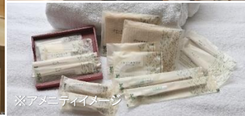
※アメニティイメージ