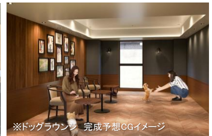
※ドッグラウンジ 完成予想CGイメージ

本ホテルの開業に際し当社では、『地球にやさしいホテル』を目指し、採用する備品、アメニティや使用する施工材料にこだわり、地球環境保護の一助となる取り組みをさらに強化しました。