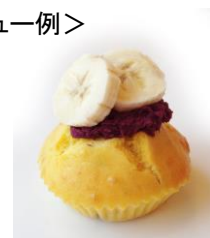
リンゴとバナナのマドレーヌ