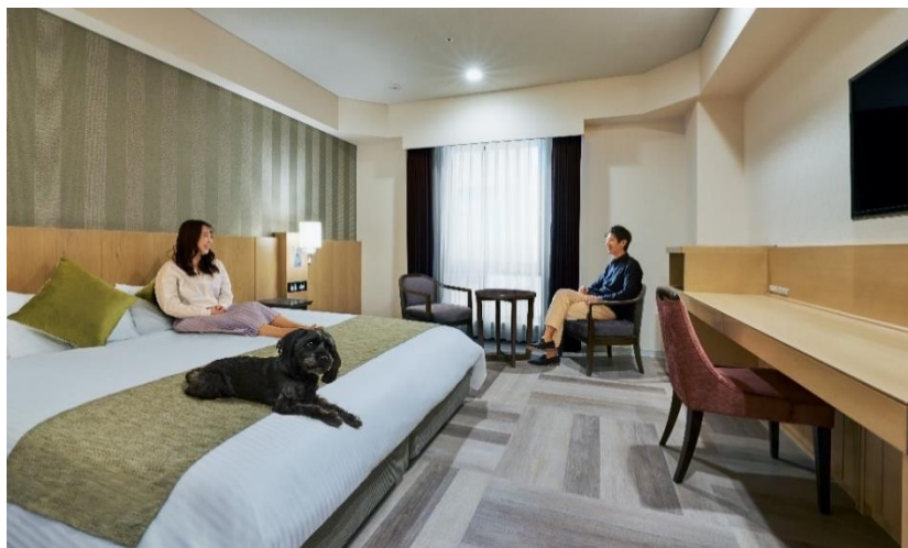
(客室滞在イメージ)

徒歩圏内に約1万3,000平米の広さを誇る芝公園や東京タワーなどの観光地があり、山手線・東京モノレールが乗り入れる「浜松町駅」からは徒歩8分、都営地下鉄三田線「御成門駅」からも徒歩2分という交通・観光利便性が高い都心エリアに位置しています。愛犬連れでの東京観光をより快適に楽しめる拠点としても、都内近郊にお住まいの方が愛犬と気軽にリフレッシュできる場所としても愛犬と過ごす新しいホテルステイを提供いたします。