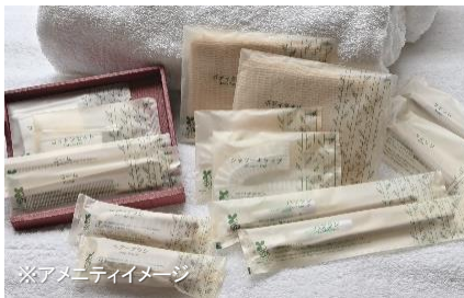
※アメニティイメージ