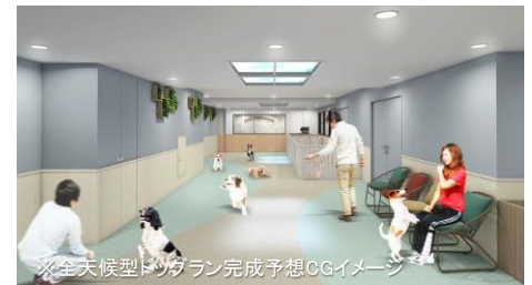
※全天候型ドッグラン完成予想CGイメージ

ホテル地下1階はご滞在中の愛犬のための専用フロアです。約76㎡の広々とした全天候型ドッグランをはじめトリミングやグルーミングを提供するサロン、お出かけ時などに便利な愛犬の一時預かりスペースを設置し、チェックインの前からチェックアウトの日まで利用できます。その他館内には愛犬のご飯を調理できるキッチンやプライベートな時間を過ごしたい時に使えるドッグラウンジをご用意し愛犬のストレスフリーな滞在をお約束いたします。また、愛犬との生活をより向上させる講座やイベントも今後開催予定です。