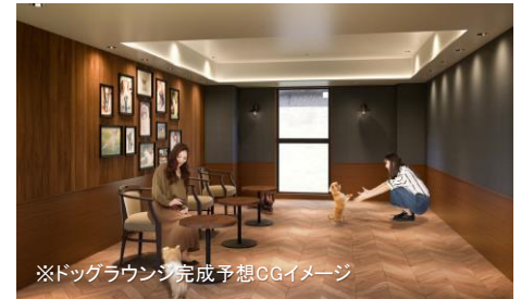
※ドッグラウンジ完成予想CGイメージ

※1…リードを付けて歩くことが出来、客室およびドッグランはノーリードで利用できます。 ※2…グルーミングは宿泊時無料でご利用いただけますが、トリミングは有料です。 ドッグラウンジは有料です。