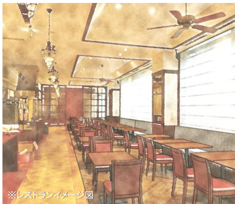
※レストランイメージ図

※食事内容は季節、仕入れ状況により異なります。 ※ご夕食やお飲み物などは別途料金が発生いたします。