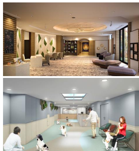
(上/ロビー 下/ドッグラン ※完成予想CGイメージ)