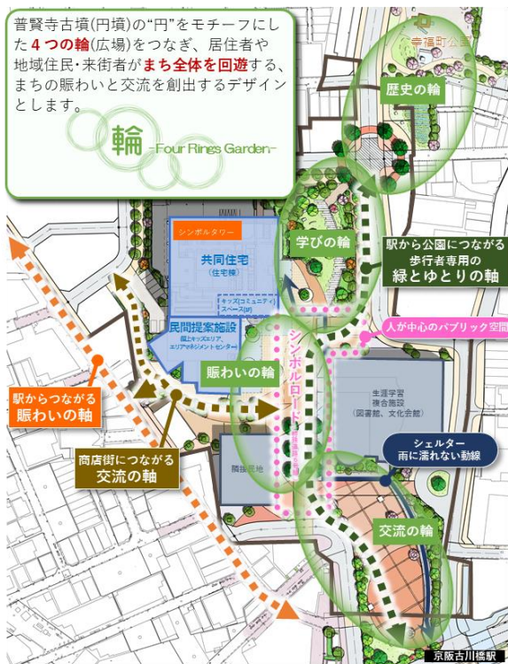
■ゾーニング・施設配置・動線計画