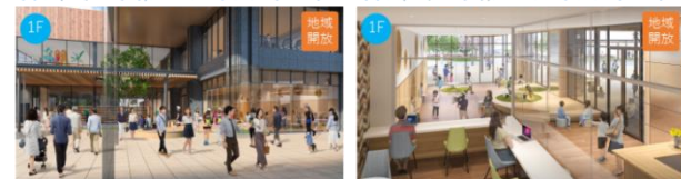
テレワークカウンター(ラウンジ)