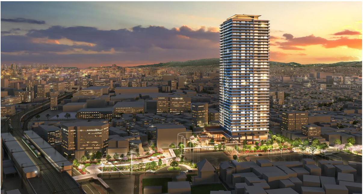
■緑とゆりの軸、及び共同住宅を一望するイメージパース（夕景）