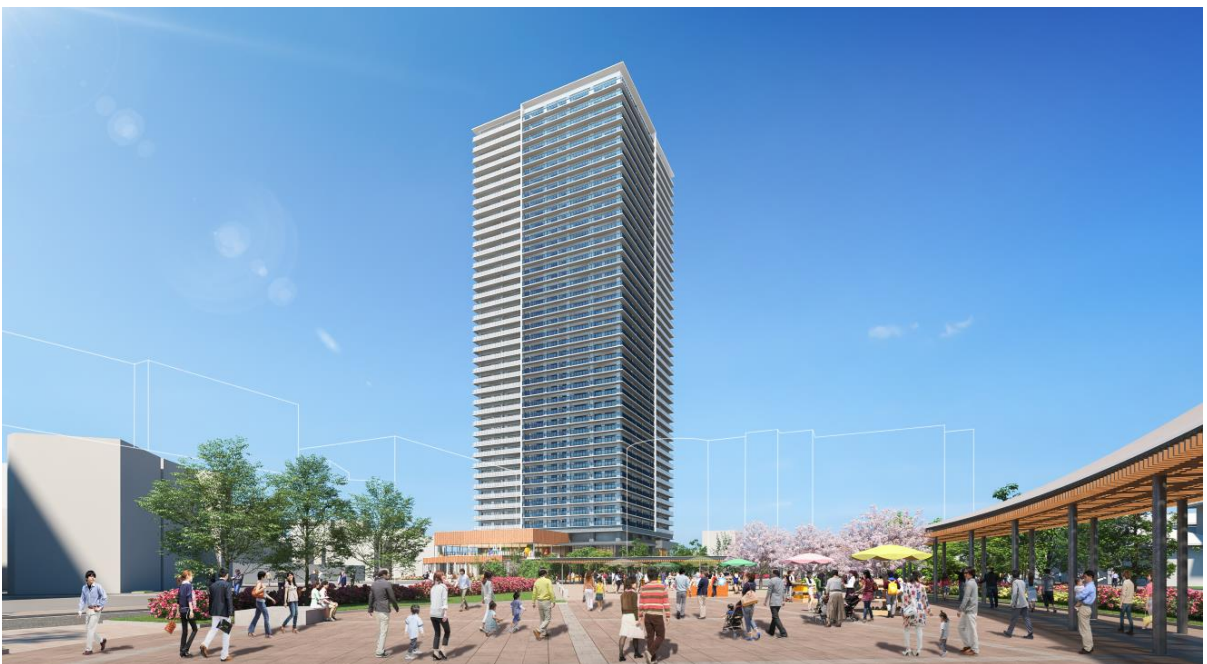
■駅前からのイメージパース