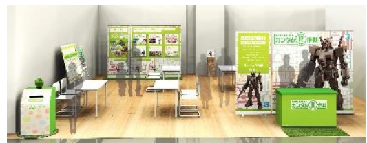
ガンダム R 作戦イベントイメージ