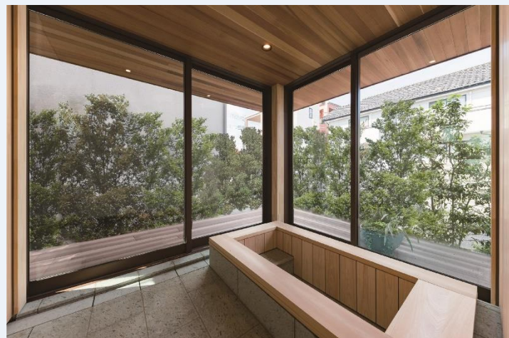
<内にいながら外を感じる浴室>