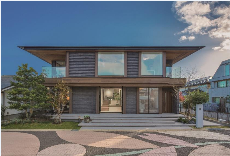
<通り路を内包している建物外観>

町の延長となる“路地空間”を近隣居住者や家族間における交流の場とし、二世帯住宅内部の中心に引き込みました。住宅と街の中間領域となる空間を設けることで、世帯も地域も自然と混じりあう新たな交流の流れを生み出す提案です。