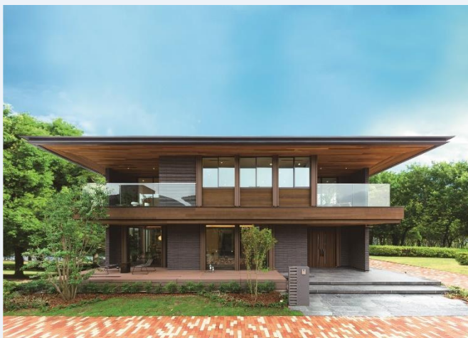
<水平ラインが作るシャープで洗練された外観>

時代と共に変わりゆく家族構成やライフスタイルの変化に沿わずに長らく定着してきた「nLDK」という間取りの概念を払拭し、新しく心地よい住まいづくりを目指しました。内外の境界を曖昧にする中間領域や外部を取り組む半外空間など、空間の区切りを「1」ではなく曖昧にするゆとりの「0.5」空間として建物に複数内包することによって、多様なライフスタイルに応える心地の良い豊かな住空間を提案しています。