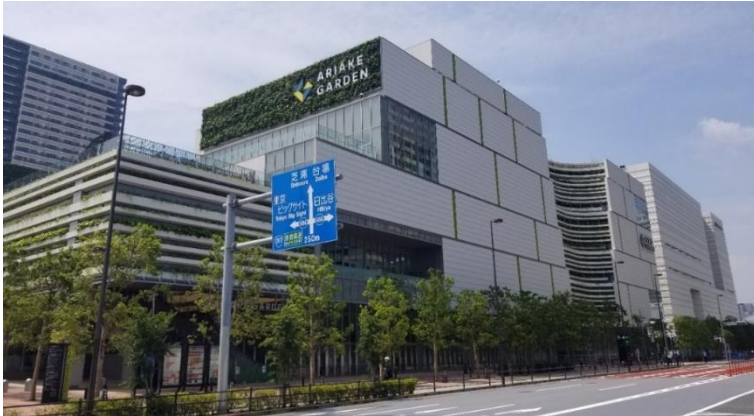
<「有明ガーデン」外観>

本表彰は、消防用設備等、特殊消防用設備等その他これらに類するもののうち、高度な消防防災技術により防火対象物の防火安全性能の向上に資するもので、他の模範となる優れたものに対して表彰されます。この度の受賞は「有明ガーデン」が、一般的な消防用設備基準に比して在館者の安全性により高い配慮をした施設として評価をいただいたものです。