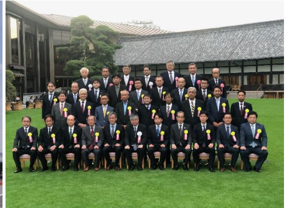
<受賞式参加者集合写真、当社代表（前列右から3番目）> 令和2年11月6日 明治記念館