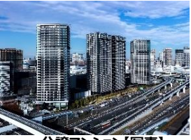
分譲マンション【写真】