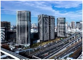
分譲マンション【写真】