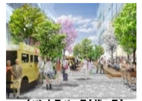
イベントスペース【パース】