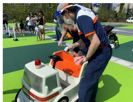
<使用した機材などを都度消毒>