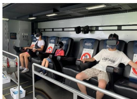
<ヘッドマウントディスプレイを装着して体験>

東京消防庁が2018年度から導入。「地震編」「火災編」「風水害編」の3つのコンテンツがあり、今回は「地震編」を体験いただきました。またVR訓練体験後には、模型を使用してご自宅内の家具の固定などを「振り返り確認」をしていただき、日頃の備えの必要性を感じていただきました。