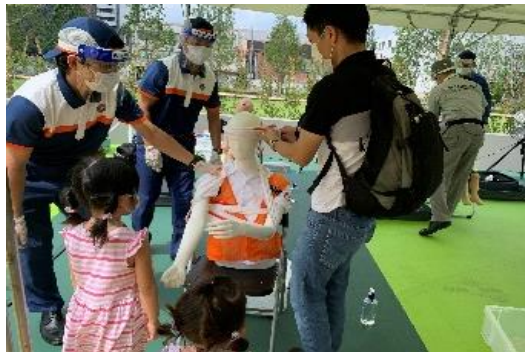
＜三角巾での応急救護、AED体験＞

「AED応急救護」や「三角巾応急救護」、「まちかど放水」や「水消火器」体験による「防災・救急スタンプラリー」ほか、機動二輪車・消防車の乗車体験、イザというときに役立つ日常アイテム紹介パネル展示、クイズ形式のソーシャルディスタンスマークなど、親子で楽しみながらも真剣に防災の知識を学べるコーナーを各所に配置し、参加された皆様は笑顔と共に防災対策への理解を深めていただきました。