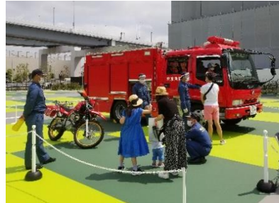
＜消防車の乗車体験＞