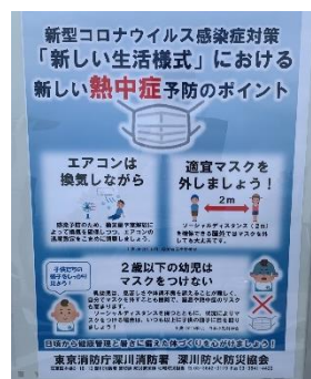
<会場内に設置された注意喚起ポスター>