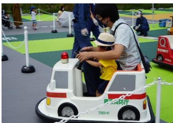
<楽しいバッテリーカー（救急車）>