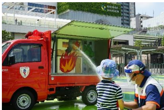
＜まちかど放水車や水消火器による消火体験＞