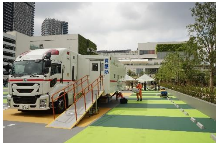
＜特殊救急車スーパーアンビュランス見学＞