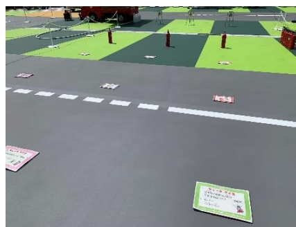
<待機列はソーシャルディスタンスマークを設置>