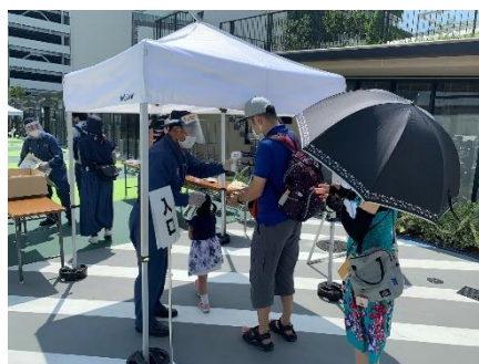
<入場時に検温、消毒>

今回のイベントは、必要な防災啓蒙でありながらコロナ禍であることを踏まえ、新型コロナウイルス感染予防対策を講じて開催いたしました。入場時の検温にはじまり、マスク着用をお願い、徹底した消毒対策、会場内が「密」状態にならないよう、入場制限、ソーシャルディスタンスの維持など対応いたしました。