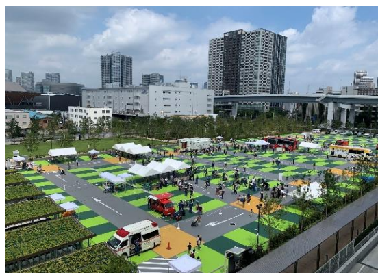
<広場でのイベント全景>

当社は、引き続き地域の皆様とともに防災力の向上に努め、安心安全で災害に強い街づくりに貢献してまいります。