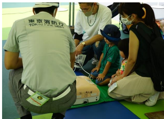
<親子で学ぶ心肺蘇生（AED）>