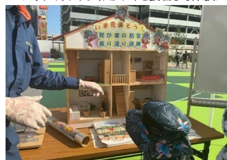
<模型を使用した家具転倒の振り返り確認>