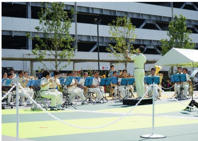
＜東京消防庁音楽隊の演奏＞

防災・救急の認知を高めるため、東京消防庁音楽隊・カラーガーズ隊をお招きしてコンサートを開催いたしました。地域にお住まいの方だけでなく、商業施設のお客様にも楽しみながらイベント開催の主旨をご理解いただくなど、当街区開催ならではのイベントとなりました。