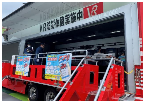
<VRを活用したリアルな災害体験>