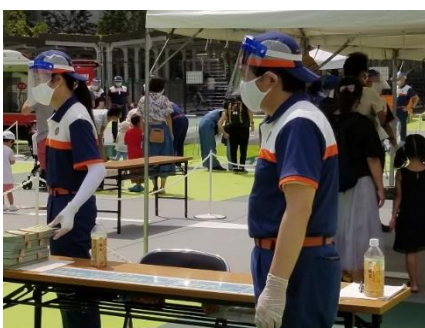
<フェイスガードなど着用しての対応>