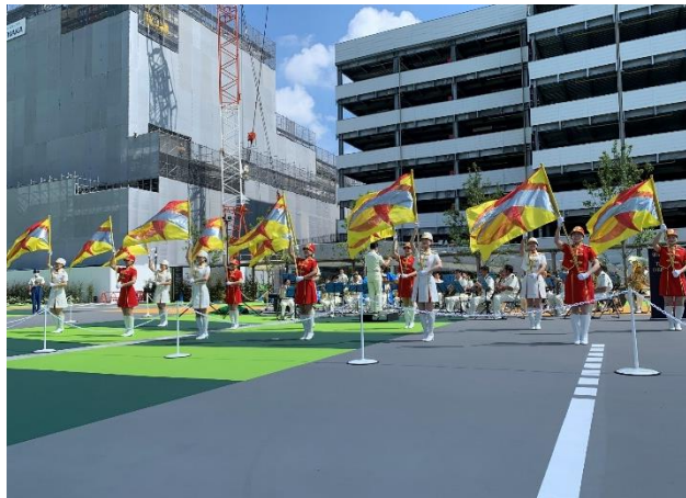
＜東京消防庁カラーガーズ隊の演技＞