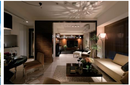
＜レジデンシャルスタイル・イメージ＞ 高級マンションの住宅設備や仕様を採用