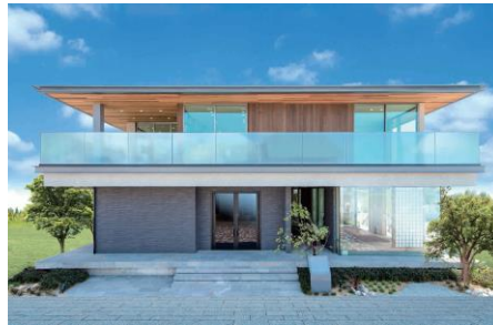
＜プレミアム・J 奈良＞ 2016年グッドデザイン賞受賞・前橋みなみモデルと同商品 (写真：奈良・柏木町モデルハウス)