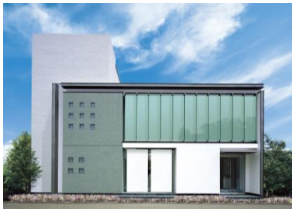
＜J・URBAN(ジェイアーバン)＞ 2003年グッドデザイン賞受賞 (写真：兵庫・加古川モデルハウス)

当社の注文住宅事業は、米国で培ったツーバイフォー工法を用いて、1982年より日本で本格的に開始し、現在では全国に営業拠点を展開しております。商品は、当社主力のオフィスビルやマンションの開発実績を活かした、ガラスを多用した個性的でモダンな外観が特徴の都市型住宅「J・URBAN」シリーズや、高級マンションの住宅設備や仕様を採用した「レジデンシャルスタイル」など、デベロッパーならではの斬新なデザイン、仕様を特徴としています。2014年より在来構法も採用し受注の幅を広げ、現在では年間3千棟超を受注しております。