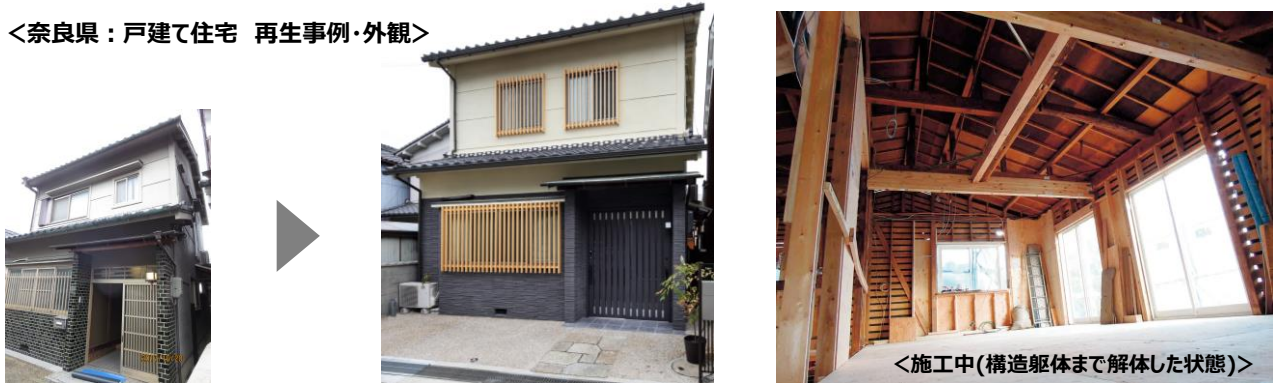
＜奈良県：戸建て住宅 再生事例・外観＞

中核となる「新築そっくりさん」は、1996年に弊社が独自開発し、建て替えに比べ約50%~70%の費用、確かな耐震補強、安心の完全定価制(※ビジネスモデル特許取得済)、専属施工統括者などの特徴を備え、リフォーム業界において革新的な商品となり事業開始より20年以上ご愛顧頂いております。戸建てやマンションだけでなく、アパートや古民家なども再生し続け、現在では年間約10,000棟を受注、累計受注棟数は13万棟を超えております(2018年12月末現在)。2010年にはリフォーム業界で初めて売上1,000億を超えるなど、業界トップブランドの地位を築いています。