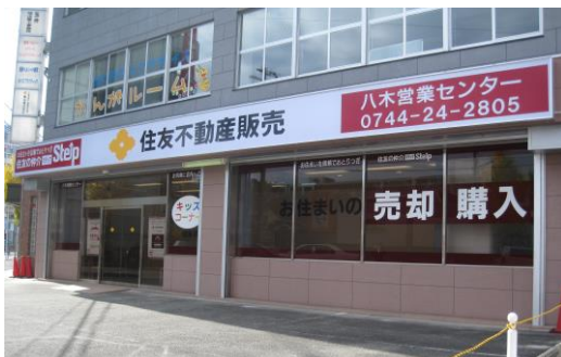
＜住友不動産販売の店舗外観＞ (写真：奈良県・八木営業センター)

当社グループにおいて、不動産仲介事業を担う住友不動産販売株式会社は、全国に271カ所の直営店舗ネットワークを構築し、中古戸建、マンション、土地などの売買仲介を中心に事業展開しております。「顧客第一主義」という理念のもと、地域密着型の営業体制を築いており、2018年度の年間仲介件数は37,643件となり4期連続で過去最高を更新しております。