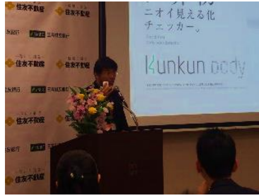
16 : 50 コニカミノルタ株式会社 ビジネスイノベーションセンタージャパン 所長 波木井 卓様 『コニカミノルタ ビジネスイノベーションセンター ジャパンにおける協業事例』