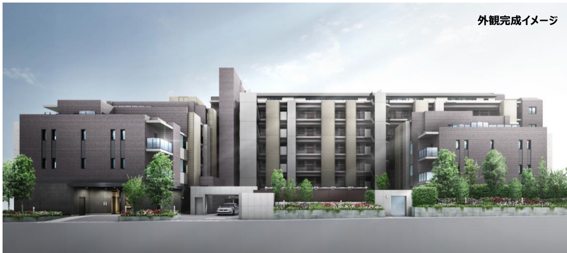
外観完成イメージ

住友不動産株式会社は、世田谷区等々力7丁目において自由が丘エリアの“洗練され成熟した街の利便性”と都心でありながら駒沢オリンピック公園などが有する“豊かな緑の潤い”を享受する新築分譲マンション「シティハウス自由が丘レジデンス」（地上8階建て、総戸数87戸）の開発をしておりますが、2018年6月23日（土）に登録を行った第一期販売の状況が下記の通り好調な結果となりましたのでお知らせします。