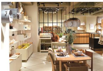
雑貨店 「IDEE SHOP」