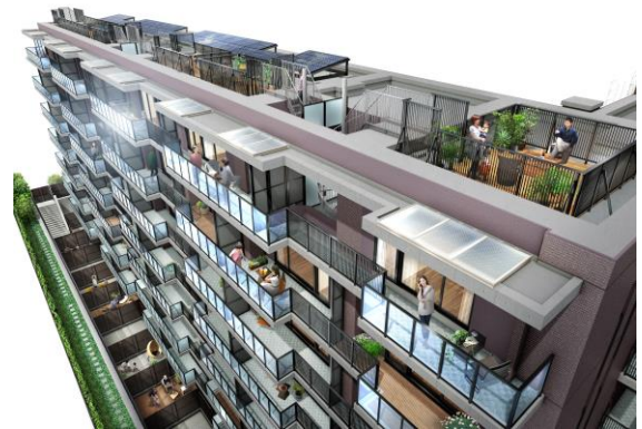
開放的な屋上のスカイルーフテラスとガラス手摺のバルコニー