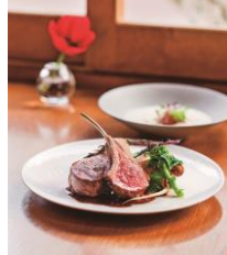
レストラン 「ルモンド グルマン」