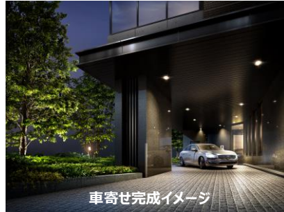
車寄せ完成イメージ