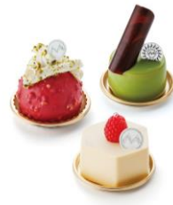
辻口シエフで有名なスイーツ店 「モンサンクレール」