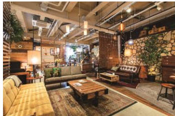
インテリア・雑貨 「アクメファニチャー」

また、バスで直接“高島屋”や“二子玉川ライズ”などエンターテイメント性も備わった二子玉川にもアクセスでき、この地での暮らしの幅を更に広めてくれます。