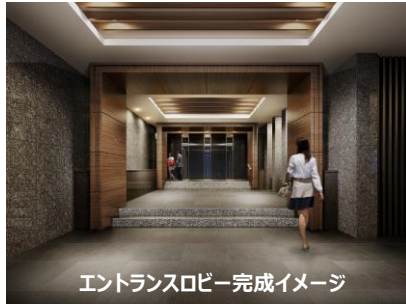
エントランスロビー完成イメージ

マンションの風格を表す外観と迎賓の空間となるエントランスロビーや車寄せは、床や壁にシルバークレーの御影石と黒のタイル、ゲートの木目調仕上げなど、多彩なマテリアルによって自由が丘の邸宅に相応しくシックな色調で重厚な深みのある空間を演出しています。