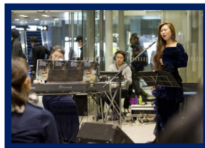
<コンサートイメージ画像>

このシーズン恒例となり、様々な楽器やジャンルで会場を盛り上げるコンサートを12月6日(水)18:00～18:30に、「六本木一丁目」駅西口直結の住友不動産六本木グランドタワー1階駅前広場にて開催します。