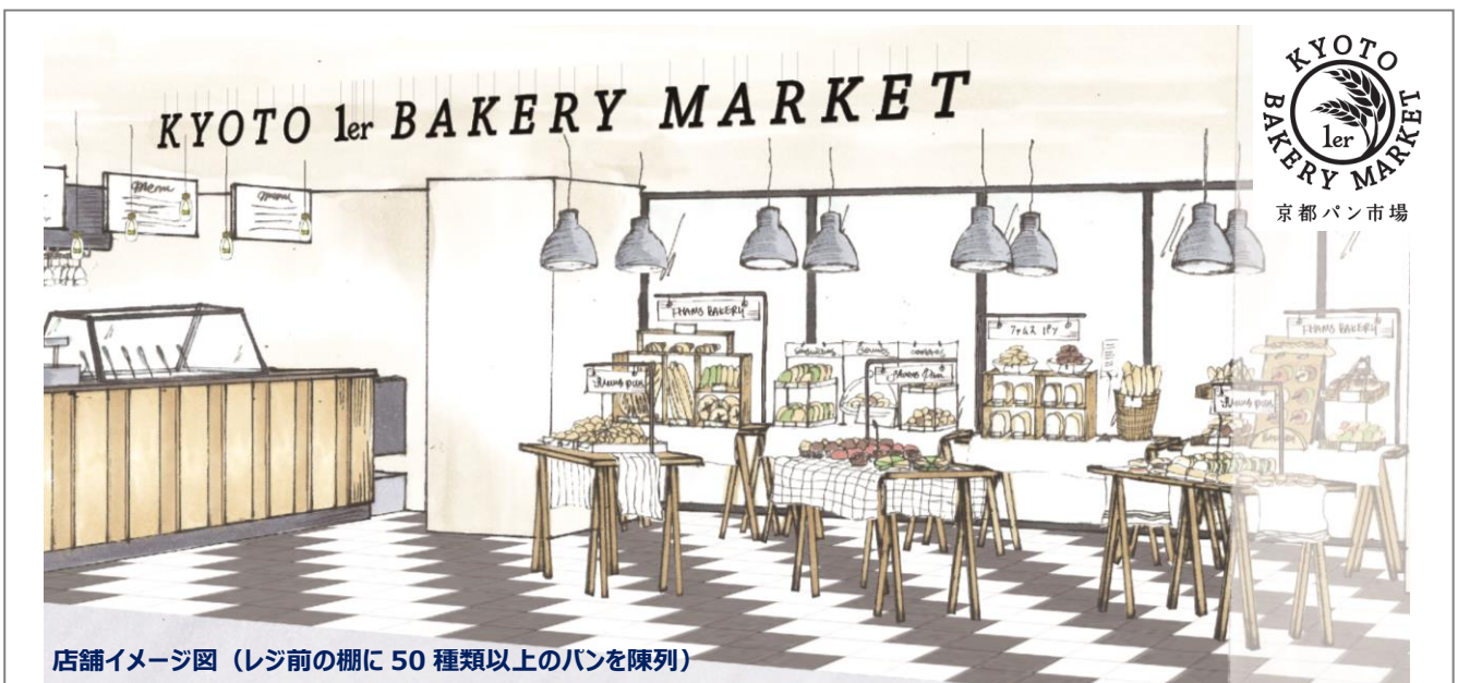
店舗イメージ図 (レジ前の棚に 50 種類以上のパンを陳列)