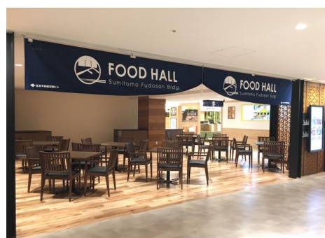
「住友不動産京都ビル FOODHALL」 “イトインコーナー”