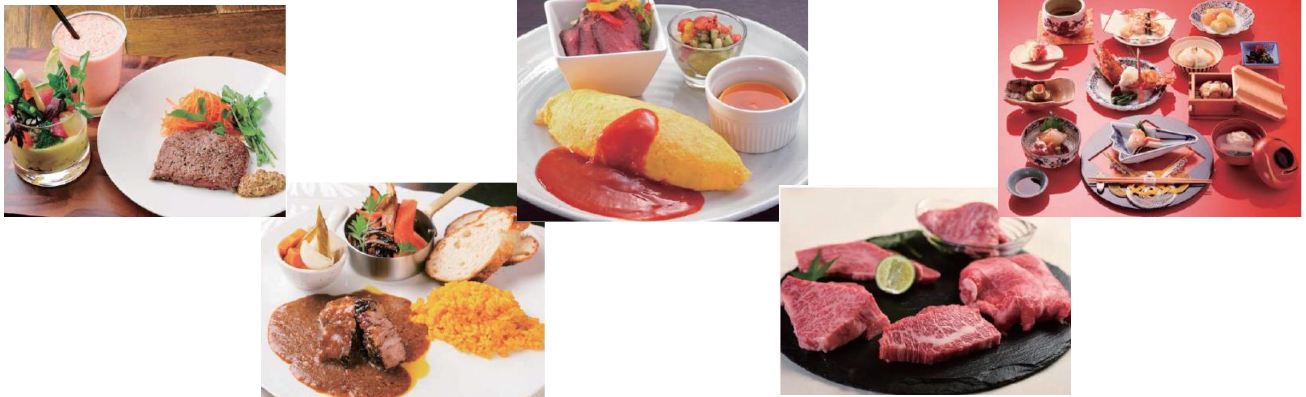
<店舗イメージ：「十彩×TANITACAFE」、「Brasserie AG」、「北極星」、「まる富」、「美濃吉」ご提供料理>

店舗は、「地元京都の方に親しまれ観光客までお楽しみいただける地元発祥店や地元になんだ“こだわり専門店街”」をコンセプトに、地元食材を使用、地元の有名なシェフが手掛けるなど京都ならではのお店を中心に新業態、初出店などの見た目も味もバラエティ豊かな全 14 店が出店しています。