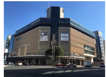
<住友不動産京都ビル 外観>