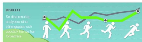
<運動履歴確認画面イメージ>