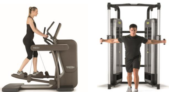
<トレーニングマシン「ARTIS」シリーズ>

トレーニングマシンをテクノジム社製の「運動履歴管理システム」に連動した「ARTIS」に一新するほか、骨格のゆがみをチェックする測定器や、心と体のストレスチェック機器などを新たに導入します。総合的なデータを活用して身体状況を把握することで、より効果的な運動を実践頂くことができます。