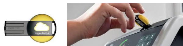
<運動履歴管理に使用する専用 IC キーとマシンへの差し込みイメージ>