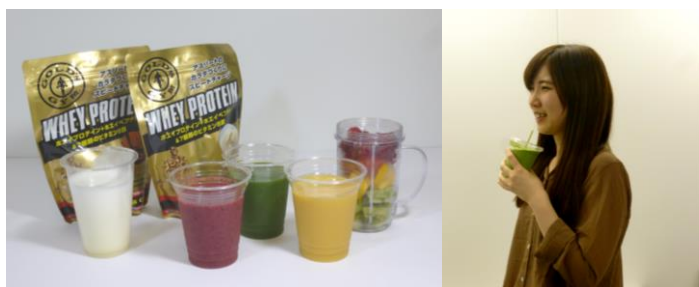
ドリンクバーで提供するプロテインやスムージー (イメージ)