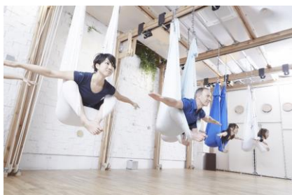
<アンティグラビティ>

スタジオは、新たな設備(天吊り棒)を設置し、天井から吊した専用の布やベルトを使用した、自重による体幹トレーニング「アンティグラビティ」、「TRX」が行えるほか、ストレッチ効果から身体機能の繋がり、連鎖向上などに効果がある「ストレッチーズ」など幅広くエンターテインメント性の高いプログラムを新たにラインナップへ加えました。また、プールはナノ水を使用し肌や髪の毛に優しい水環境を整えている等、より快適な空間でエクササイズをお楽しみいただけます。