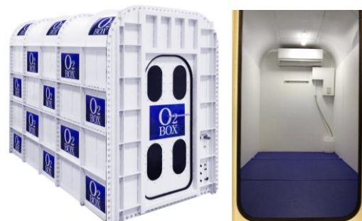
複数名同時に使用できる「高気圧酸素ルーム」の外観と内観 (イメージ)