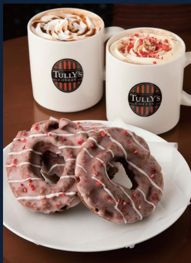
TULLY'S COFFEE OEDO 日本橋店

【提供期間】12/23～25日 【電話】03-3510-9637 【営業】11:30～14:30、17:30～23:00 【定休】日祝 ※コース料理は要予約