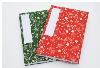
クリスマスカラーの朱印帳(¥1,700)

「日本橋二丁目地区北地区」の開発計画に伴い、計画の中核となる「東京日本橋タワー」敷地内に、2015年5月、装いを新たに新築・移転されました。店内には、お土産や贈り物に最適な各種和紙の小物が揃っています。