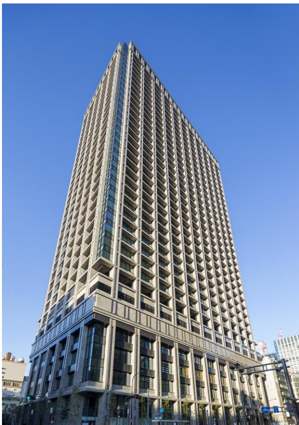
「東京日本橋タワー」外観