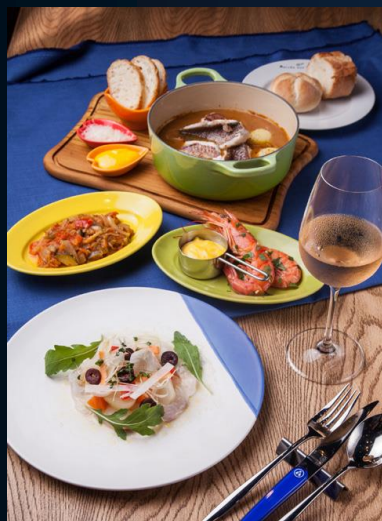
マルシェ オ ポワソン Marche aux Poissons

「東京日本橋タワー」飲食店舗ゾーンは、ビルで働く人から街に訪れる人までが楽しめる、日本橋らしい品格のある和食、本格的な異国料理、和の要素を採り入れたカフェなどを取り揃えています。多くの人が街に溢れるクリスマスシーズンに向けて、東京日本橋タワーのショップに限定メニューが登場します。