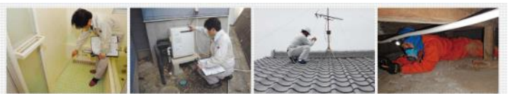
数名の専門スタッフが各種ガイドラインに準拠した点検項目を確認します。

屋根・外壁・室内・小屋裏・床下などの劣化状態を把握する、いわば病院の「健康診断」です。現状が分かり、住まいの不安面などを踏まえ、的確にリフォーム計画を立てていただけます。