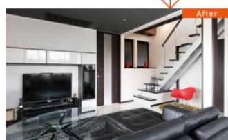
※写真は当社施工イメージです。