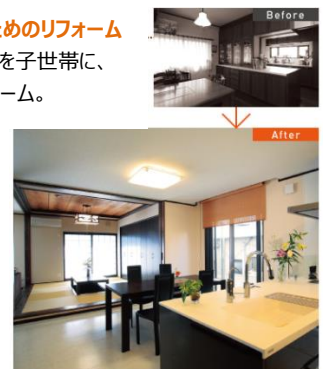
※写真は当社施工イメージです。